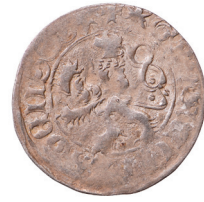
Tabela V. Grosze praskie ze skarbu z Grodzca (pow. zlotoryjski)