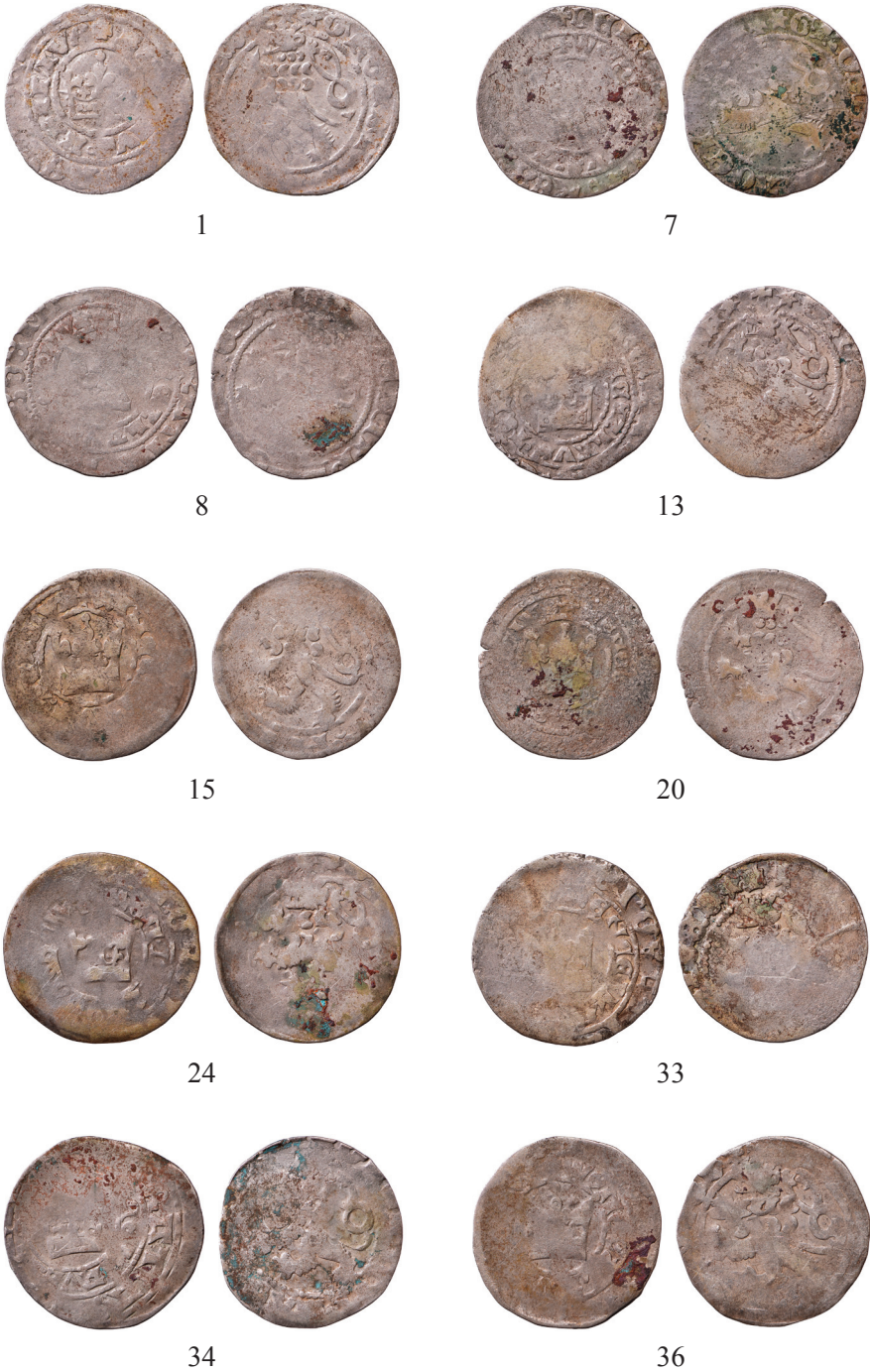
Tabela I. Grosze praskie ze skarbu z Grodzca (pow. złotoryjski)