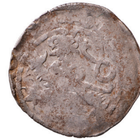
Tabela III. Grosze praskie ze skarbu z Grodzca (pow. zlotoryjski)