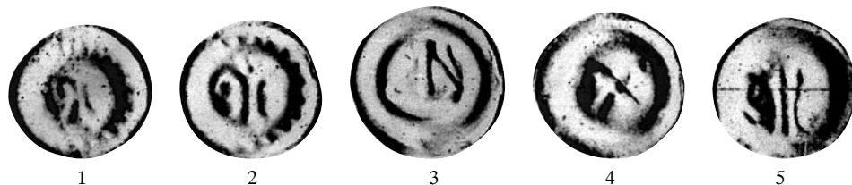
Ryc. 1–5: Brakteaty biskupów kamieńskich wg A. Suhlego (reprodukcja z mikrofilmu)