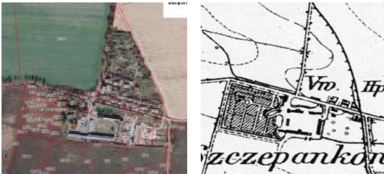
Il. 3. Zestawienie mapy historycznej Mestischblatt z 1913 r. ( http://mapy.amzp.pl/maps.shtml ) ze współczesną ortofotomapa, zawierającą informacje o podziałach katastralnych ( http://mapy.geoportal.gov.pl ), przedstawiająca założenie dworsko-folwarczne z ogrodem użytkowym w Szczepankowie, jednym z dawnych majątków na terenie Poznania. Widoczny wtórny podział ogrodu na działki budowane

Fig. 3. A 1913 Messtischblatt ( http://mapy.amzp.pl/maps.shtml ) vs a contemporary orthophotomap ( http://mapy.geoportal.gov.pl ) with cadastral data. The maps show a manor and grange complex with a goods garden in Szczepankowo (a former estate in Poznań) with contemporary cadastral division of the garden into building plots.