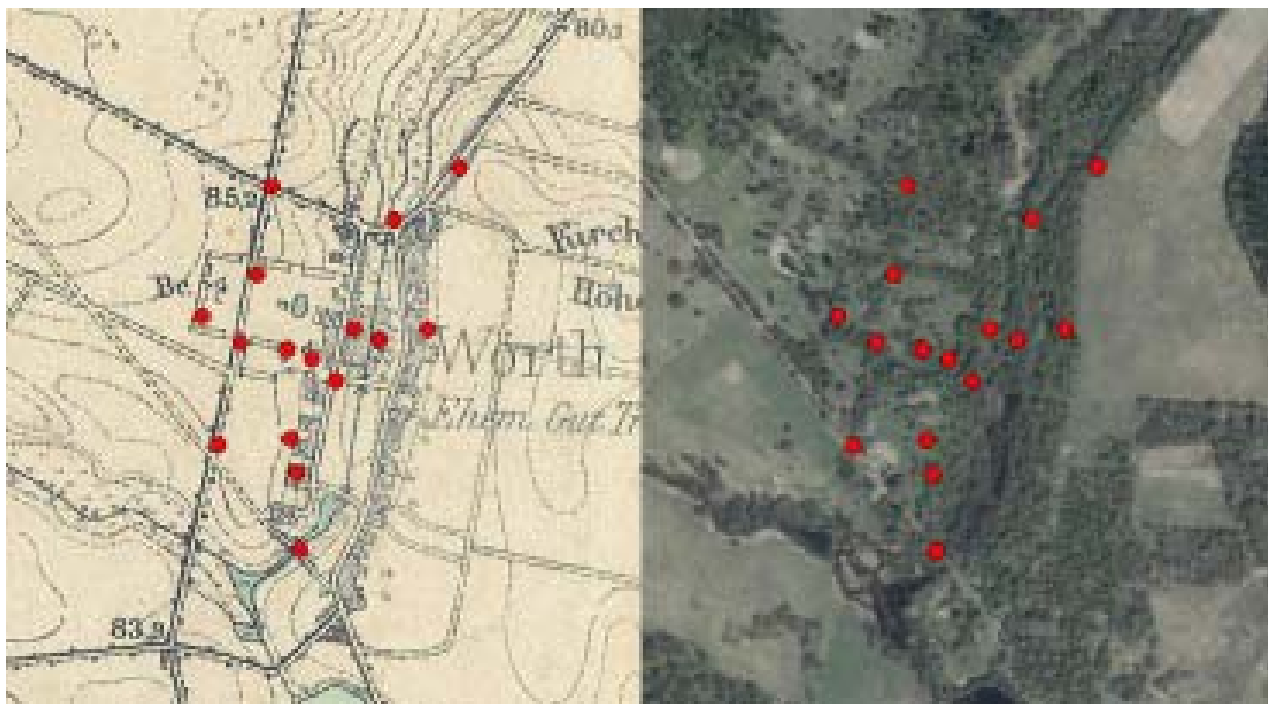
Il. 1. Punkty charakterystyczne wsi Trzuskotowo odnalezione w terenie (na czerwono), których współrzędne zapisano z pomocą urządzenia GPS, następnie wprowadzono do oprogramowania GIS. Po lewej identyfikacja punktów według mapy historycznej z 1911 r. ( http://mapy.amzp.pl ), po prawej dla porównania stopnia przekształcenia krajobrazu aktualna ortofotomapa tego terenu ( http://mapy.geoportal.gov.pl )

Fig. 1. The landmarks in the village of Trzuskotowo found during field investigations (marked in red). Their coordinates were recorded with a GPS device and entered into GIS software. Left: Spots identified on a historical map made in 1911 ( http://mapy.amzp.pl ); Right: A current orthophotomaps of the area ( http://mapy.geoportal.gov.pl ).