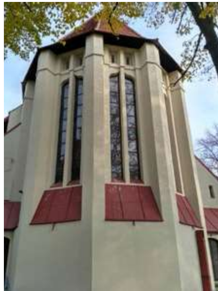
Ryc. 11. Prezbiterium.