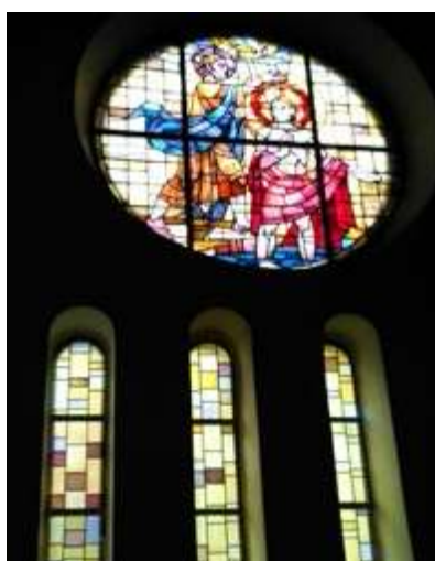
Ryc. 17. Okno witrażowe