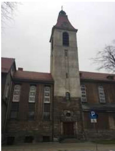
Ryc. 6. Wieża kościoła.

„VENITE AD ME OMNES”. Elewacja północna obecny kształt uzyskała pod koniec lat 70. XX wieku. W oryginalnym założeniu składała się z dwóch fragmentów: zdobionej czterema pilastrami i dwoma eliptycznymi oknami części zakończonej neobarokowym zwieńczeniem rozpoczynającym się na wysokości krawędzi dachu nawy głównej oraz znajdującego się powyżej trójkątnego frontonu z pojedynczym owalnym oknem. Po dodaniu kruchty zmieniła się forma elewacji oraz została ona uwspółcześniona. Oblicowane piaskowcem boki fasady rozszerzono ku dołowi, a na jej osi, w miejscu ułożenia chóru, umieszczono schodkowy element pokryty blachą miedzianą. Wejście do kruchty zadaszono.