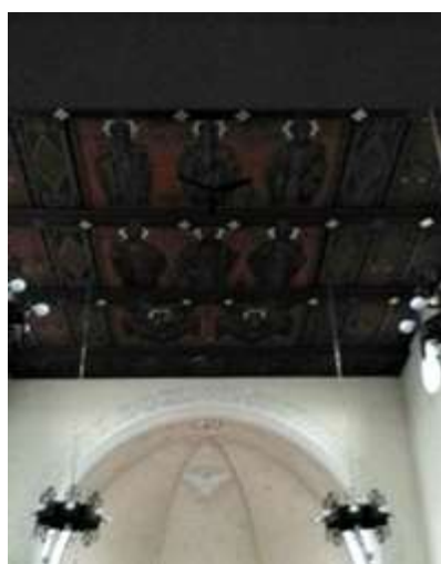
Ryc. 16. Drewniany sufit z wizerunkami apostołów