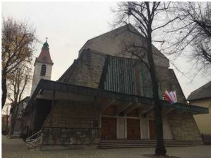
Ryc. 7. Przebudowana elewacja północna.