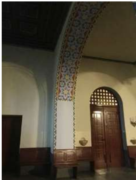
Ryc. 4. Fragment arkady nawy bocznej.