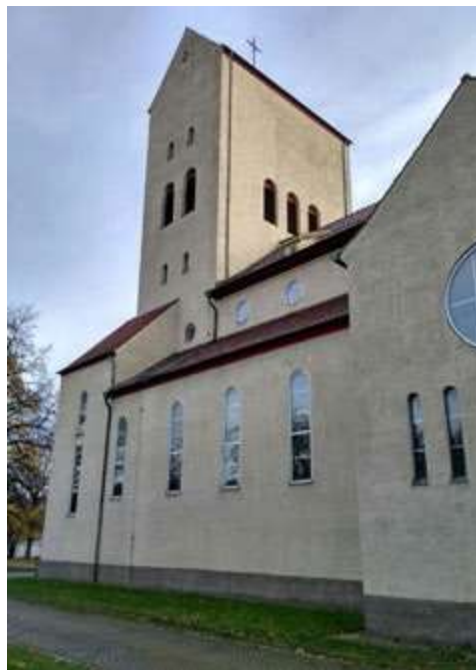
Ryc. 15. Fragment elewacji południowej