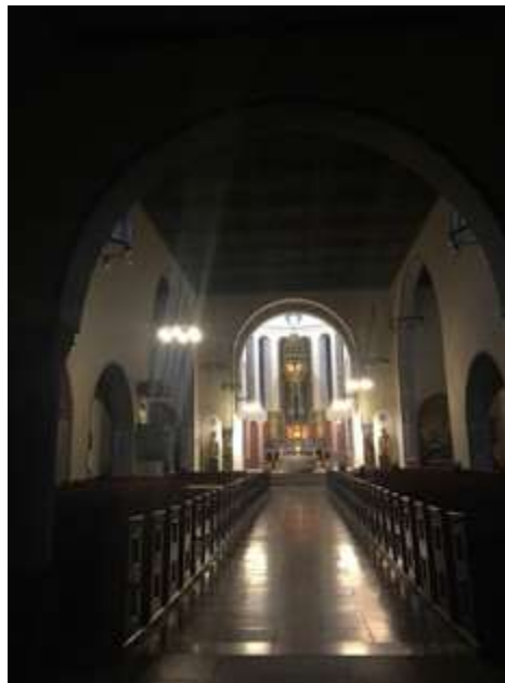
Ryc. 5. Wnętrze kościoła.

W projekcie zastosowano tradycyjne rozwiązania przestrzenne, jednak zastosowanie betonu miało zdecydowany wpływ na jego nowoczesną, zewnętrzną formę. Widoczny rysunek deskowań dodatkowo podkreśla jej surowość. Na uwagę zasługuje również prostota wnętrza, które, za wyjątkiem złożonych ołtarzy bocznych, zdobione jest dość oszczędnie. Do wykonania całości świątyni zastosowano lokalnie dostępne materiały takie jak cement, drewno, czy piaskowiec, z którego wykonano chrzcielnicę oraz kropielnice.