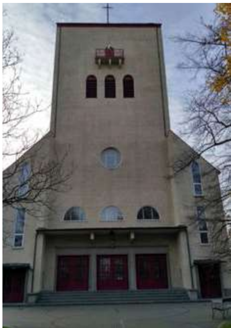
Ryc. 14. Elewacja zachodnia

znajdują się trzy łukowe okna, a ponad nimi niewielki balkon, do którego wejście obecnie jest zamurowane. Boki wieży flankowane są przybudówkami. Podobnie jak w przytoczonych wyżej rozwiązaniach detalem tworzącym elewacje boczne jest rytm okien. W nawie głównej są to osiowo rozmieszczone okna okrągłe, natomiast w nawach bocznych znajdują się otwory zakończone łukowo. W bocznych elewacjach wieży umieszczono po siedem otworów - dwa duże łukowe okna, a poniżej i powyżej nich po parze sporo mniejszych o takiej samej formie. Najmniejsze z nich zdoła natomiast szczyt ściany. Dachy nawy głównej i wieży są dwuspadowe, natomiast naw bocznych i przybudówek pulpitowe, wszystkie kryte dachówką ceramiczną. Obiekt został wzniesiony z cegły, a następnie otynkowany.