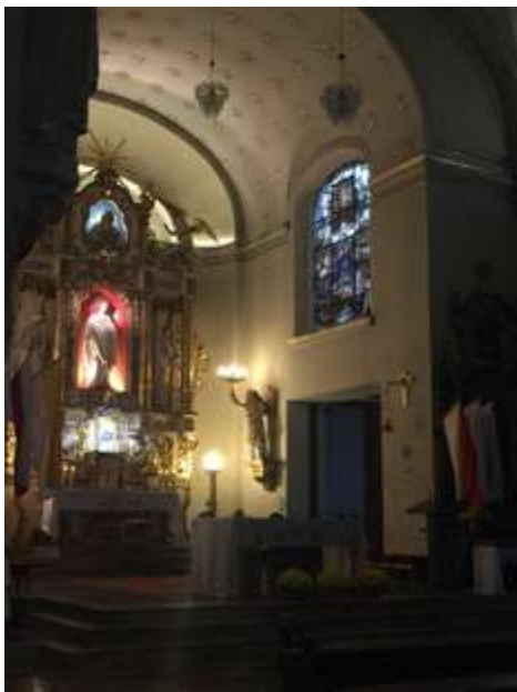
Ryc. 8. Widok wnętrza kościoła.