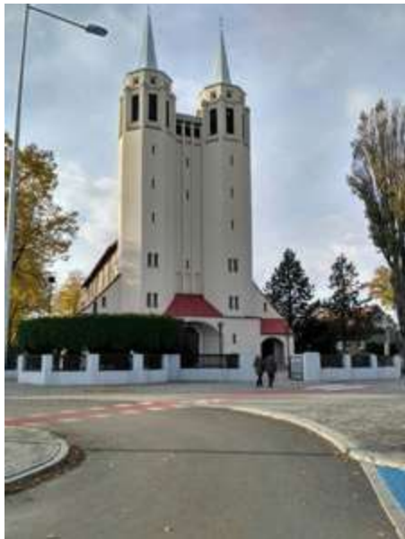
Ryc. 10. Elewacja wschodnia z dwoma wieżami.