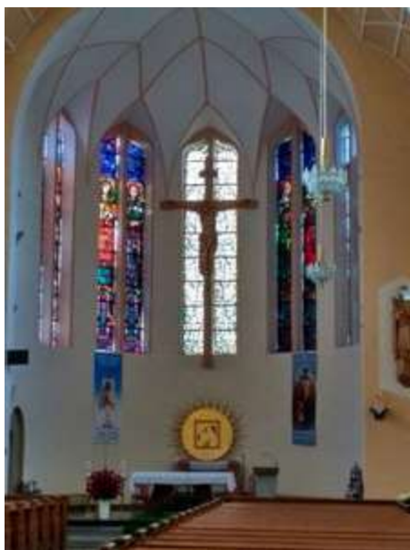
Ryc. 12. Wnętrze kościoła.