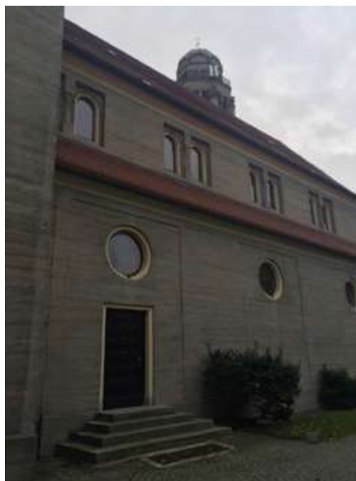
Ryc. 3. Fragment elewacji północnej z widocznymi śladami deskowań.