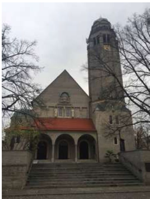
Ryc. 2. Widok kościoła od strony zachodniej.

jest trójnawowym, orientowanym obiektem na planie krzyża łacińskiego, w układzie bazylikowym z transeptem i jedną wieżą ulokowaną po stronie zachodniej. Przed frontową fasadą znajduje się rozległy taras, do którego prowadzi 11 betonowych schodów. Kolejne pięć schodków prowadzi do kruchty z arkadami, w której ulokowano troje drzwi wejściowych. Po prawej stronie od kruchty znajduje się wieża, której czworoboczna podstawa przechodzi w ośmiobok na wysokości sklepienia nawy głównej. Wieża zdobiona jest figurami aniołów i gryfonów oraz zegarami. Przekryto ją kopulastym hełmem wykonanym z blachy miedzianej. Poza wieżą, pozostała część bryły pozbawiona jest zdobień, elewacja jest surowa, nieotynkowana, z widocznymi śladami deskowań. W nawach bocznych umieszczono po trzy okrągłe, witrażowe okna. W transepcie i prezbiterium wstawiono okna arkadowe, o formie zbliżonej do biforium, znajdujące się w parach płytkich nisz przedzielonych półkolumną. Zarówno nawa główna jak i transept przekryte są wysokimi dachami dwuspadowymi, natomiast nawy boczne – pulpitowymi.