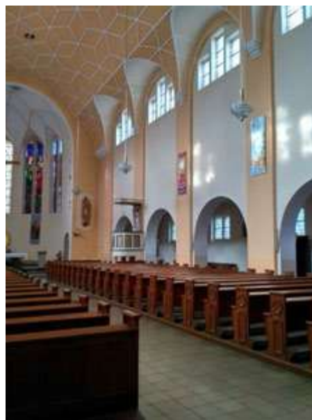
Ryc. 13. Widok na część ołtarzową.