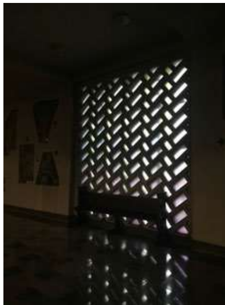
Ryc. 9. Współczesny detal architektoniczny.