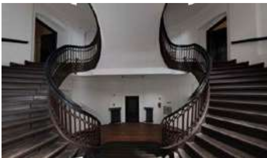
Ryc. 3. Ryc. 3