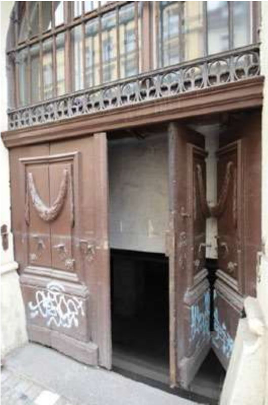
Ryc. 7. Ryc. 7