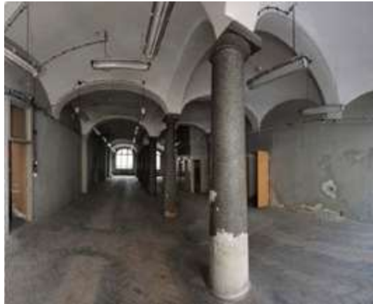
Ryc. 8. Ryc. 8