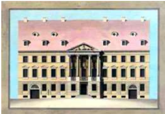
Ryc. 1. Ryc. 1

Ryc 10 Pałac Wallenberg-Pachalych. Rysunek inwentaryzacyjny 1. piętra.