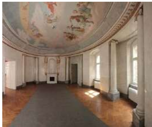
Ryc. 4. Ryc. 4