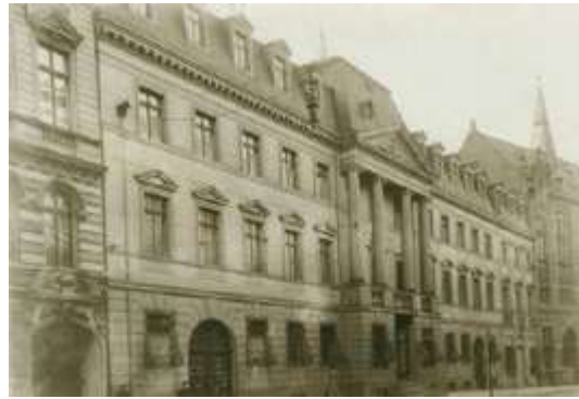
Ryc. 2. Ryc. 2