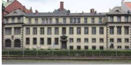
Ryc. 6. Ryc. 6