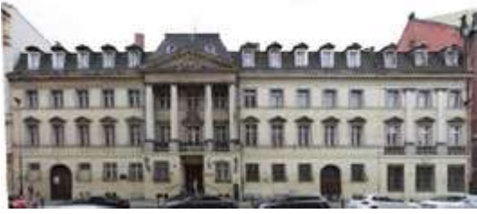
Ryc. 5. Ryc. 5