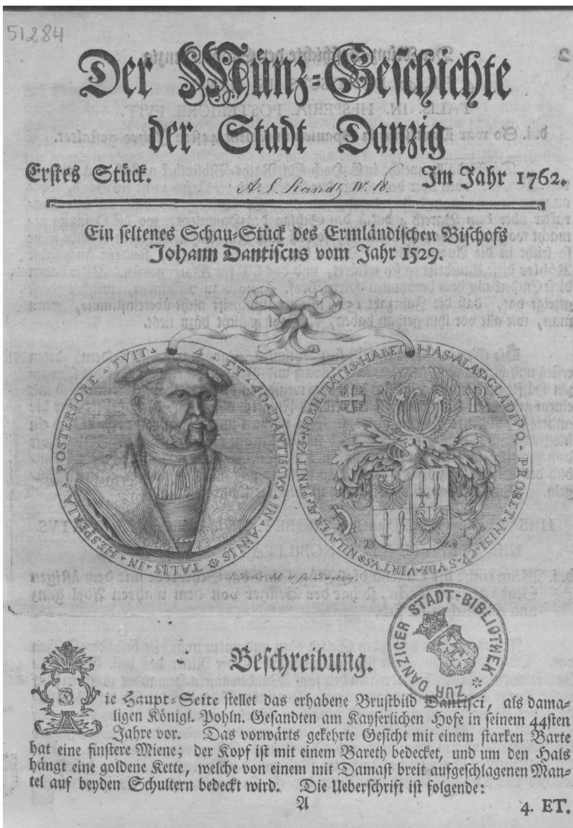
7. [67] J.J. Salomon, Münzgeschichte der Stadt Danzig , Danzig 1762, karta tytułowa (PAN Biblioteka Gdańska, sygn. Od 9156 a 8°)