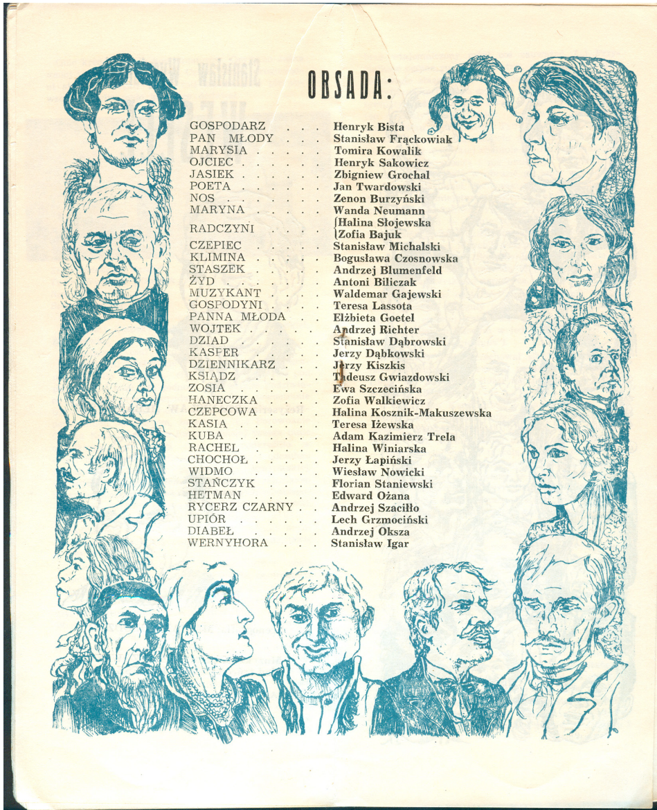
3. S. Wyspiański, Wesele , program Teatru Wybrzeże z 1976 roku, s. [16–17] (PAN Biblioteka Gdańska, nr inw. 306/76)