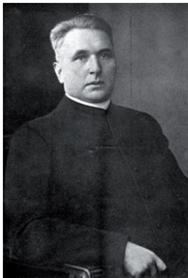
1. Ks. Magnus Bruski (1886–1945) (PAN Biblioteka Gdańska)