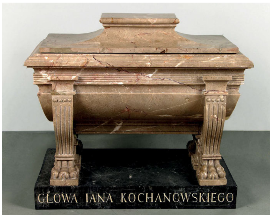
7. Urna na Głowę Jana Kochanowskiego , ok. 1810, marmur chęciński, 28,8 x 48,7 x 38 cm, nr inw. MNK XIII-2318, Muzeum Czartoryskich, w zbiorach Muzeum Narodowego w Krakowie