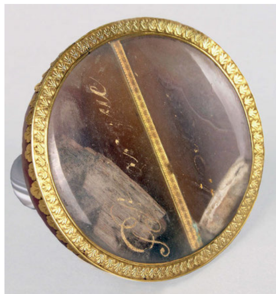
10. Relikwiarz z pamiątkami Petrarcki i Laury, Francja (?), ok. 1820, brąz, agat, szkło, 6,60 x 8,2 x 5,5 cm; nr inw. MNK XIII-973, Muzeum Czartoryskich, w zbiorach Muzeum Narodowego w Krakowie, fot. Pracownia Fotograficzna Muzeum Narodowego w Krakowie

Co ważne, fetysze puławskie zyskiwały na znaczeniu za pomocą siły oddziaływania dotyku 57 . Uderzającym przykładem owej „sztuki haptycznej” jest pojemnik na relikwie Petrarcki i Laury 58 (il. 9–10). Jego wnętrze zostało podzielone na dwie oznaczone francuskimi podpisami połowy, z których jedna zawiera tzw. cząstkę szafki Petrarcki, którą Izabela postanowiła oprawić, jak opisuje w swoim eseju, „razem w wazeczkę z kostką z ręki Laury. Niech ta pamiątka dwóch osób, które się tak przed pieciowiekami kochały, razem w Gotyckim Domu będą połączone” 59 . Ten nietypowy koncept zjednoczenia pozostałości kochanków po stuleciach rozłąki staje się celebracją siły pożądania, którą Czartoryska podkreśla w zakończeniu eseju, przywołując dopisek poety o śmierci ukochanej w osobistym manuskrypcie Wergiliusza, poprzez co akt recepcji antycznego wieszczka stał się bodźcem do cyklicznej konfrontacji z poniesioną stratą 60 .