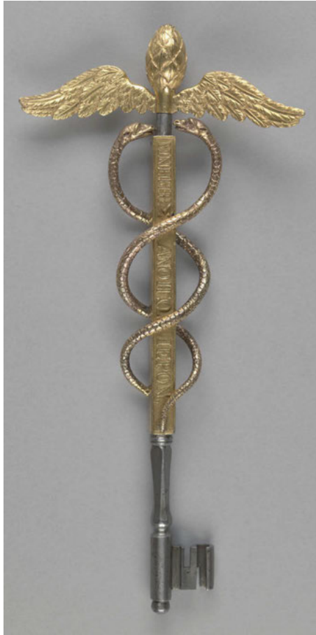
1. Enrico Ittar (proj.), Klucz do Świątyni Sybilli , ok. 1801–1805, złożony brąz, 32 x 2 cm, szer. skrzydeł: 15,5 cm, nr inv. MNK XIII-1337, Muzeum Czartoryskich, w zbiorach Muzeum Narodowego w Krakowie

Alternatywne spojrzenie na ambicje ekspozycji puławskiej sugeruje wspomniany w opisie Potockiego „klucz od Sybilli” projektu Enrico Ittara w kształcie kaduceusza, który został ofiarowany Izabeli przez jej córkę Marię Wirtemberską (il. 1) 15 . Jego grecka inskrypcja, którą sformułował bibliotekarz rodu,