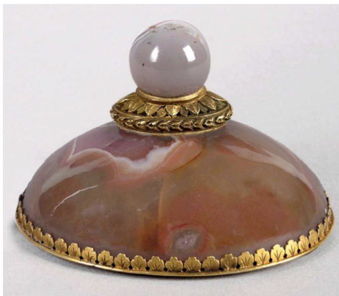
9. Relikwiarz z pamiątkami Petrarcki i Laury, Francja (?), ok. 1820, brąz, agat, szkło, 6,60 x 8,2 x 5,5 cm; nr inw. MNK XIII-973, Muzeum Czartoryskich, w zbiorach Muzeum Narodowego w Krakowie

wcześniejszych magnackich tradycji zbierania pamiątek historycznych z najnowszymi odkryciami geograficznymi i (pseudo)etnograficznymi 56 . Przewycięzanie ograniczeń materialnych przestrzeni i chronologicznej linearności czasu było podstawowym elementem kreowania aury pamiątek Izabeli, pod wpływem której skłonności fetyszystyczne patrzących nie były traktowane z zakłopotaniem, ale nawet stały się fundamentem nowego modelu patriotyczności.