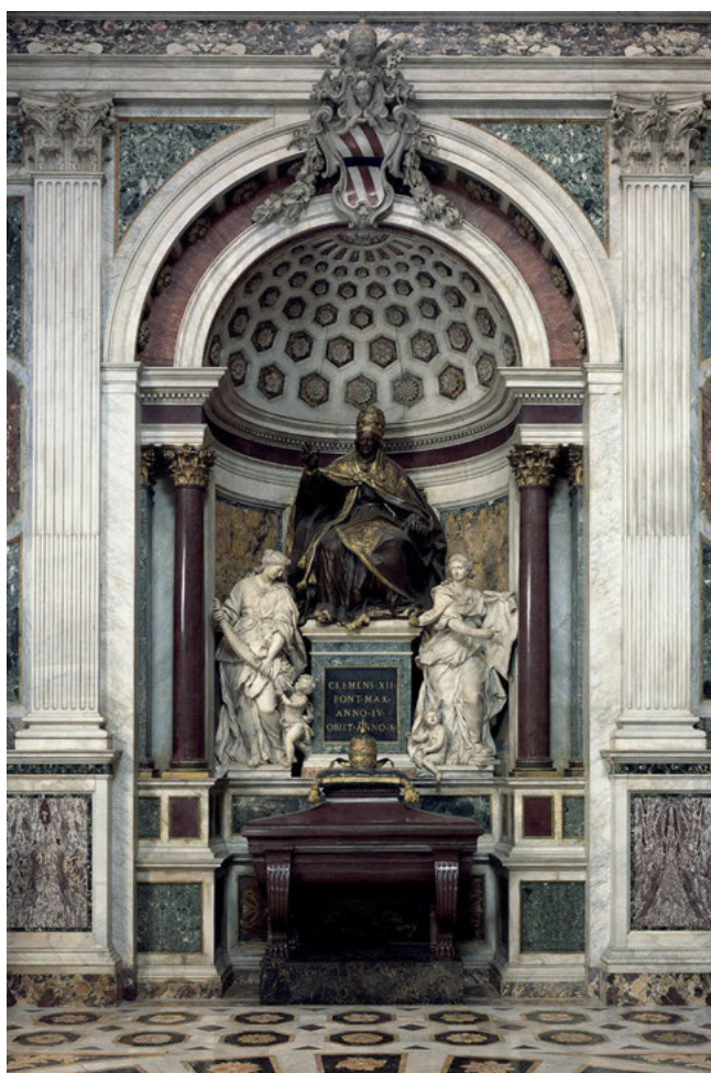
8. Alessandro Galilei, Giovanni Battista Maini [et al.], Grób Klemensa XII Corsini, 1734–1735, marmur, złocony brąz, porfir, Kaplica Corsini, Bazylika św. Jana na Lateranie, Rzym