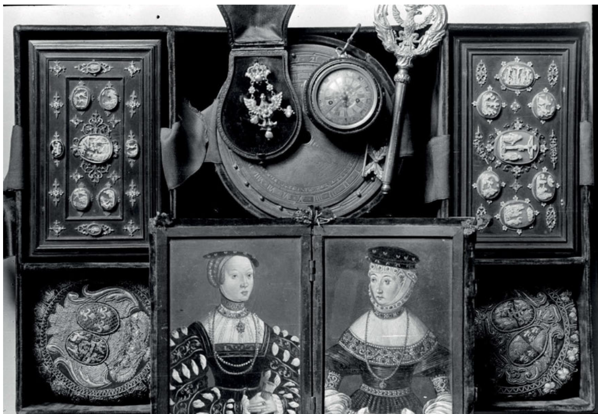
5. Szkatuła Królewska, warstwa 4.2, fotografia z ok. 1939, nr inw. PP.1, Archiwum Muzeum Narodowego w Krakowie, fot. S. Komornicki