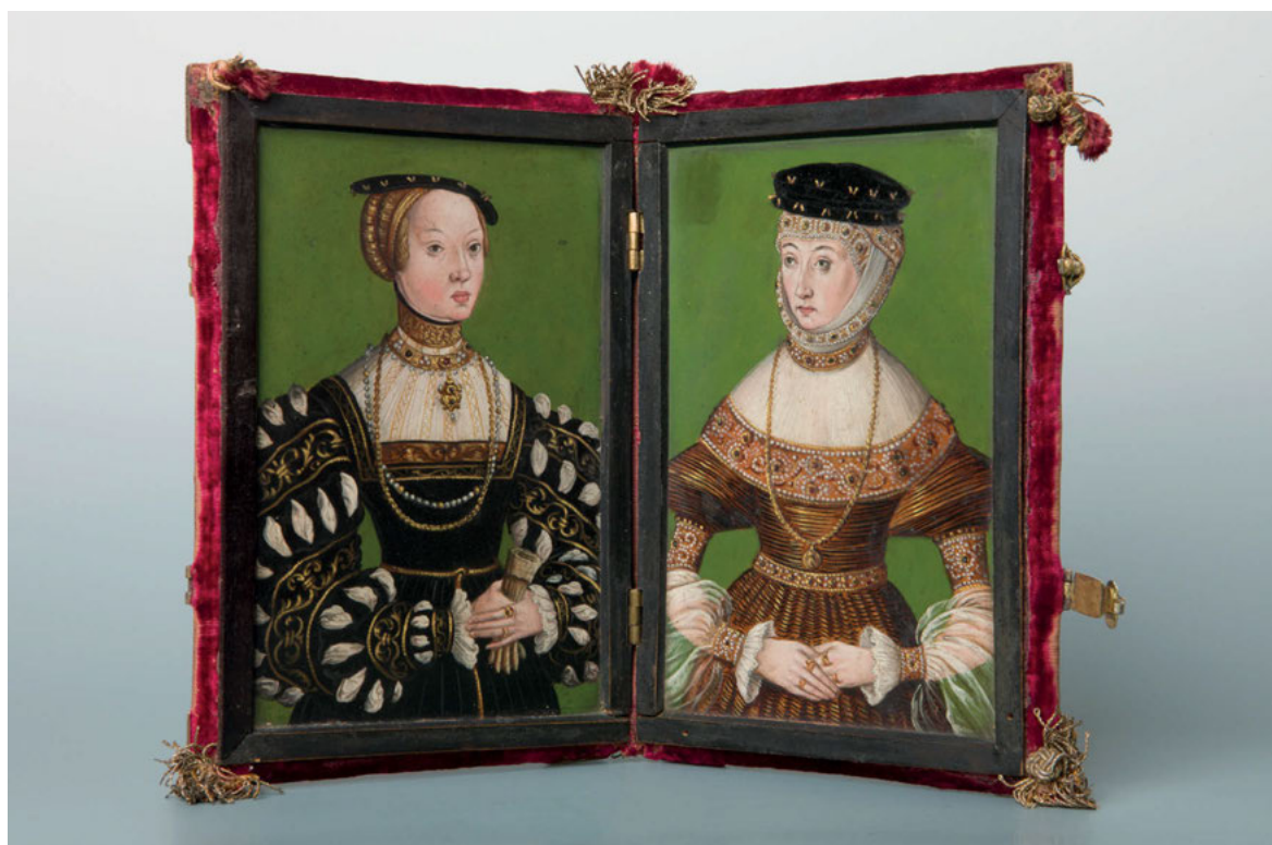
6. Dyptyk z portretami żon króla Zygmunta Augusta, Elżbiety Austriaczki i Barbary Radziwiłłówny, ca. 1543–1551, olej na blasze, drewno, złoczone srebro, aksamit, 17,3 x 12 cm, nr inw. MNK IV-V-1433, Muzeum Czartoryskich, w zbiorach Muzeum Narodowego w Krakowie, fot. Pracownia Fotograficzna Muzeum Narodowego w Krakowie