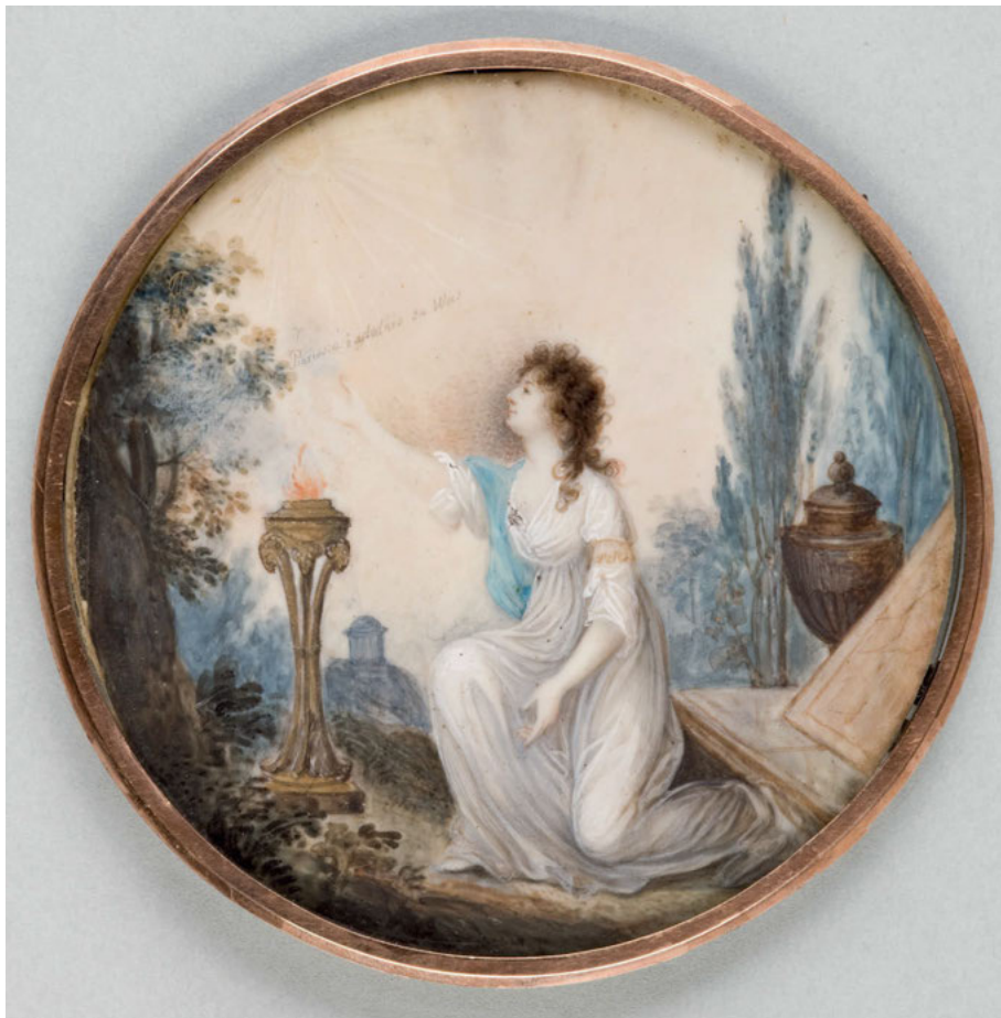
2. Józef Kosiński, Izabela Czartoryska jako Sybilla Puławska , ok. 1800, akwarela i gwasz na kości, śr. 8,5, nr inw. MNK III-min-53, Muzeum Czartoryskich, w zbiorach Muzeum Narodowego w Krakowie, fot. Pracownia Fotograficzna Muzeum Narodowego w Krakowie

W tym ujęciu Izabela staje się przewodnikiem w rytualnej wędrówce po sferze Zaświatów, podobnie jak na miniaturze Józefa Kosińskiego, której nieduży rozmiar i osobisty charakter umożliwiły przekaz bardziej