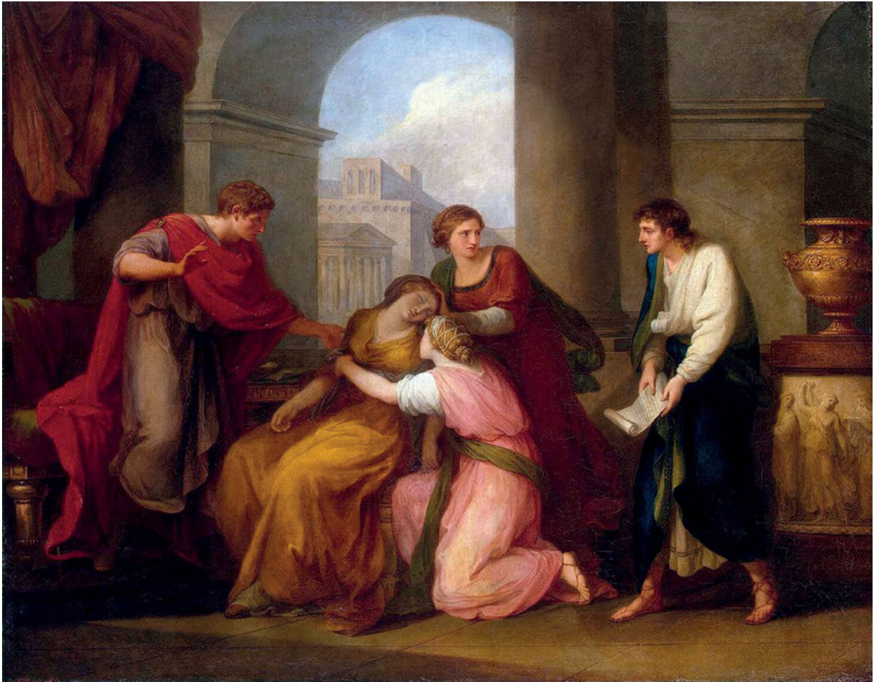
3. Angelika Kauffmann, Wergiliusz czytający Eneidę Augustowi i Oktawii , 1788, olej na płótnie, 123 x 159 cm, nr inw. ГЭ-4177, Państwowe Muzeum Ermitażu, Sankt-Petersburg

nie chwilowej fuzji temporalnej, której moc oddziaływania wynika z samej niesamowitości odczuwanego stanu zawieszenia między czasem rzeczywistym a wyobrażonym. Jednocześnie ma ona na celu aktywowanie samospełniającej się przepowiedni, wywołanej przez podkreślenie nagłej straty nasilającej potrzebę jej zastępstwa, którego przeznaczenie wymownie podsumował Franciszek Morawski, oficer i poeta z kręgu Czartoryskich: „lecz dopóki nie zapomnimy tego, co nam ta Sybilla na pamięć przywodzi, póty będziemy narodem, póty żyje Polska” 43 . Kruchość pamięci staje się inspiracją do oporu względem imperialnej opresji poprzez kultywowanie kolejnych wcieleni przeszłych bohaterów.