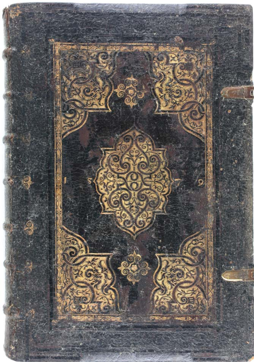
Il. 4. Oprawa z dekoracją orientalizującą, intrologator anonimowy, Polska, 1579.