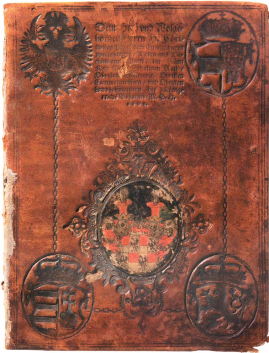
Il. 2. Oprawa manierystyczna, anonimowy introligator dworski cesarza Rudolfa II Habsburga, Praga 1606, repr. według P. Voit, Kostbare Bucheinbände... , Prag 2020