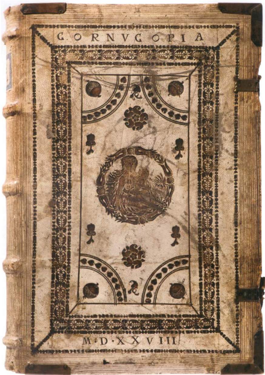
Il. 1. Oprawa renesansowa, Mistrz Prawa Czeskiego, Praga, 1528, repr. według P. Voit, Kostbare Bucheinbände... , Prag 2020