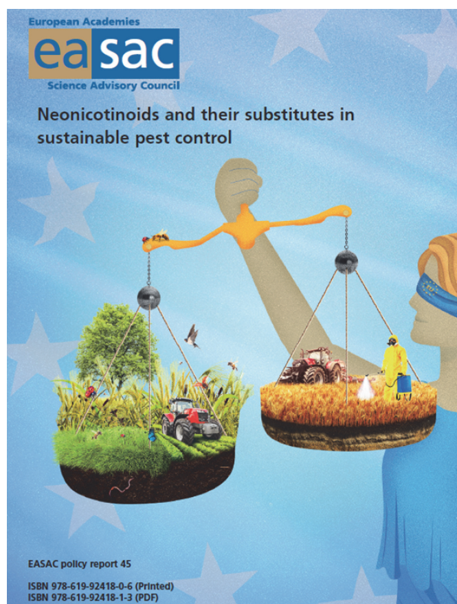
Ryc. 2. Niniejszy Raport (EASAC, 2023) jest dostępny na stronie: https://easac.eu/fileadmin/PDF_s/reports_statements/Neonics/EASAC_Neonicotinoids_complete_Web_02032023.pdf

EASAC popiera obecne działania Komisji Europejskiej mające na celu wspieranie praktyk IPM w ramach wspólnej polityki rolnej (WPR). Omawiany raport został opublikowany przez EASAC Publications Office (ryc. 2).