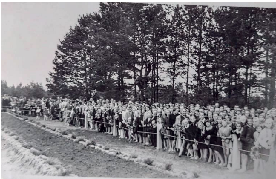
Zdjęcie 2. Uroczystość odsłonięcia pomnika w Kosówce (13 września 1959 roku).