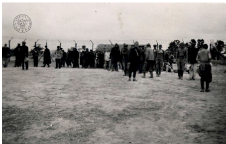
Zdjęcie 6. Prostken 1941. Krall 12 [Prostki 1941, Zagroda 12].