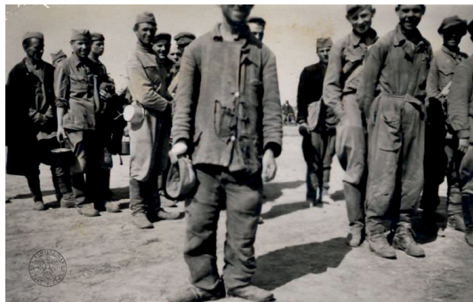
Zdjęcie 5. Prostken 1941. Ein „Jude” [Prostki 1941. Żyd]. Źródło: Archiwum Instytutu Pamięci Narodowej w Warszawie 27 .