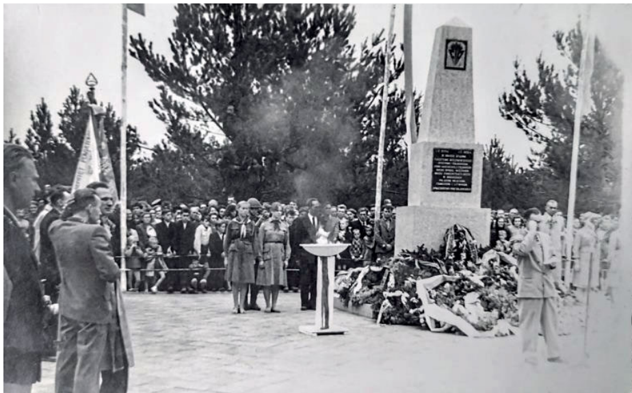
Zdjęcie 1. Uroczystość odsłonięcia pomnika w Kosówce (13 września 1959 roku).