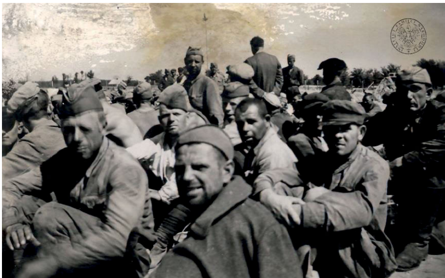
Zdjęcie 3. Prostken 1941, Erholungspause bei d. Kgf. [Prostki 1941, Przerwa na odpoczynek jeńców].