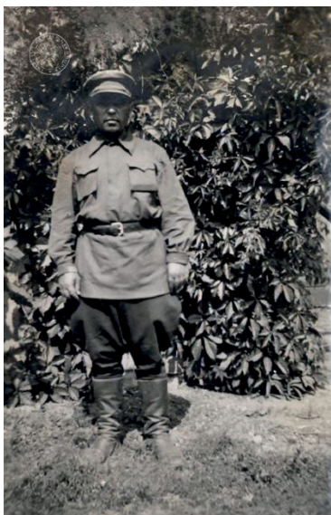
Zdjęcie 4. Prostken 1941, Herr „Kommissar” [Prostki 1941, Pan „komisarz”].