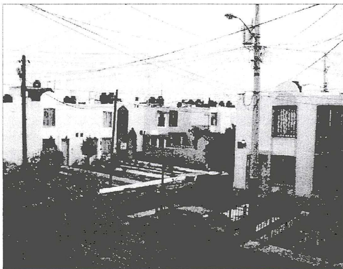
Fot. 1. Brama wjazdowa i organizacja przestrzeni w jednym z osiedli zamkniętych w Zapopan (obszar metropolitalny Guadalajary)