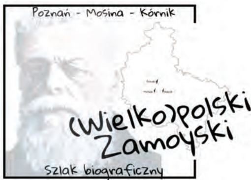
Il. 1. Logotyp szlaku – propozycja 1. Oprac. Partycja Kryszczak

Aplikowanie naszej propozycji w realny szlak wymagałoby m.in. zamontowania tablic kierunkowych oraz informacyjnych; szlak mógłby także we wstępnej fazie funkcjonować jako wirtualny, wskazywany przez przewodniki czy źródła internetowe. Von Rohrscheidt podkreśla, że zmaterializowany szlak musi być dostępny i spójny tematycznie oraz oznaczony in situ , winien zatem spełniać kryterium zaopatrzenia w: nazwę, kategorię, adres i telefon koordynatora, informację o długości, mapkę oraz logotyp. Dlatego też zaprojektowaliśmy dwa egzemplifikacyjne logotypy z twarzą hrabiego oraz schematycznymi mapkami Wielkopolski i grafikami (il. 1 i 2).