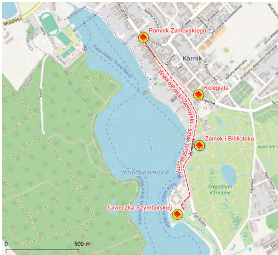
Il. 4. Przebieg szlaku w Kórniku.