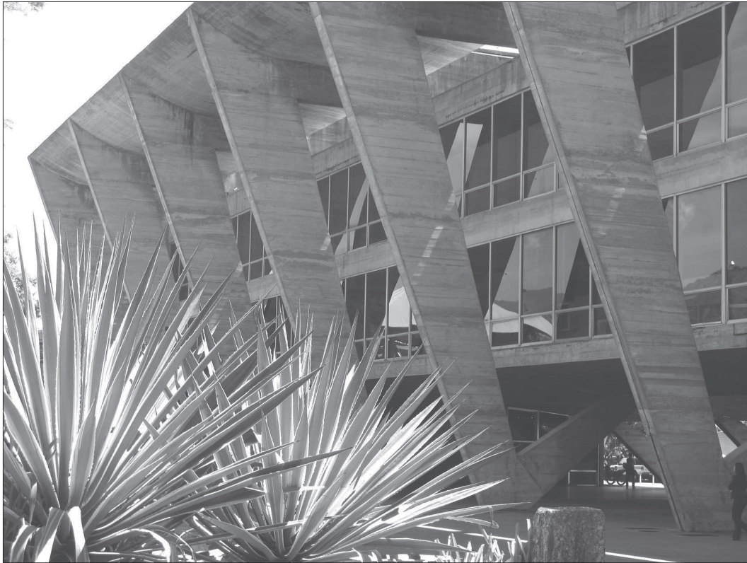
21. Affonso Reidy, Muzeum Sztuki Nowoczesnej (1953–1968), Rio de Janeiro (RJ) 21. Affonso Reidy, Modern Art Museum (1953–1968), Rio de Janeiro (RJ)