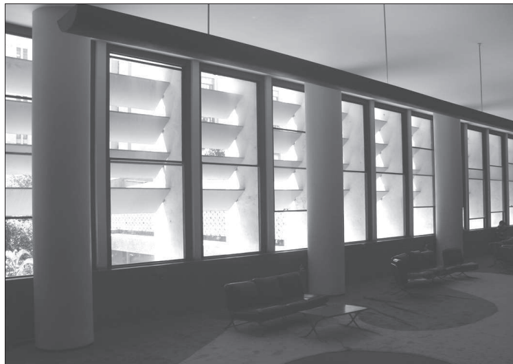
4. Lucio Costa, Oscar Niemeyer z zespołem, Ministerstwo Edukacji i Zdrowia (1937–1943), Rio de Janeiro (RJ), ruchome przesłony widziane z wnętrza budynku