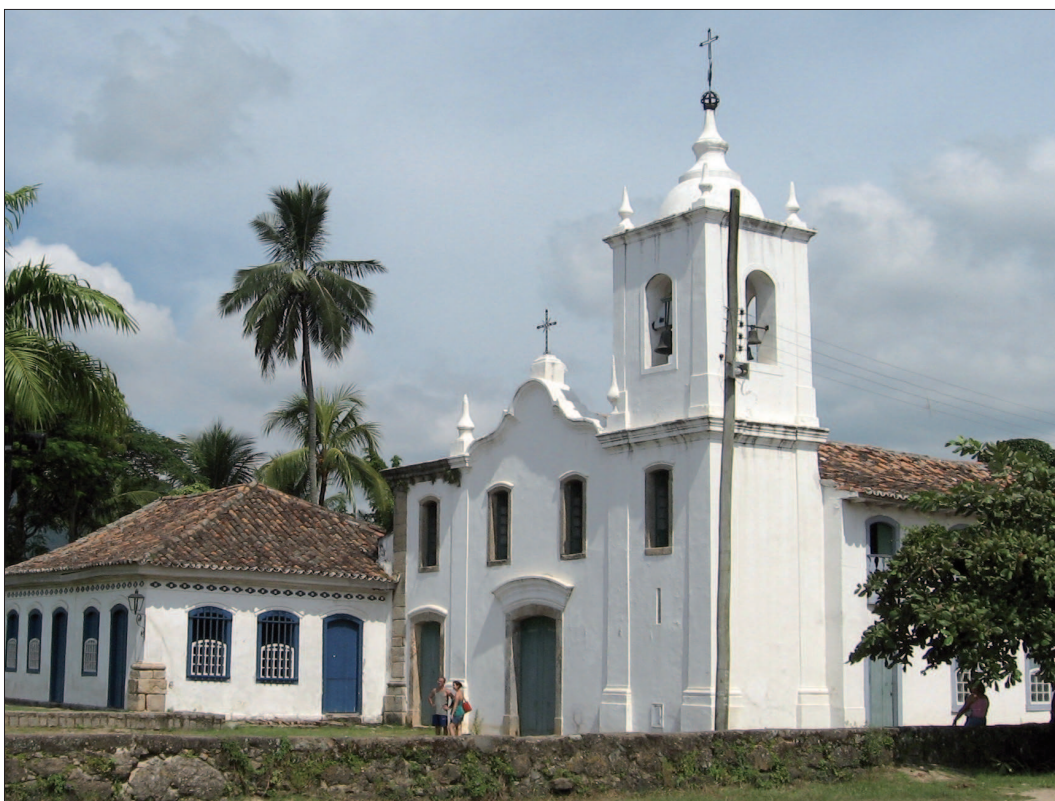
1. Barokowa architektura wybrzeży Atlantyku - kościół Nossa Senhora das Dores (XVII w.), Paraty (RJ) 1. Baroque architecture of the Atlantic coast – Nossa Senhora das Dores church (17th century), Paraty (RJ)