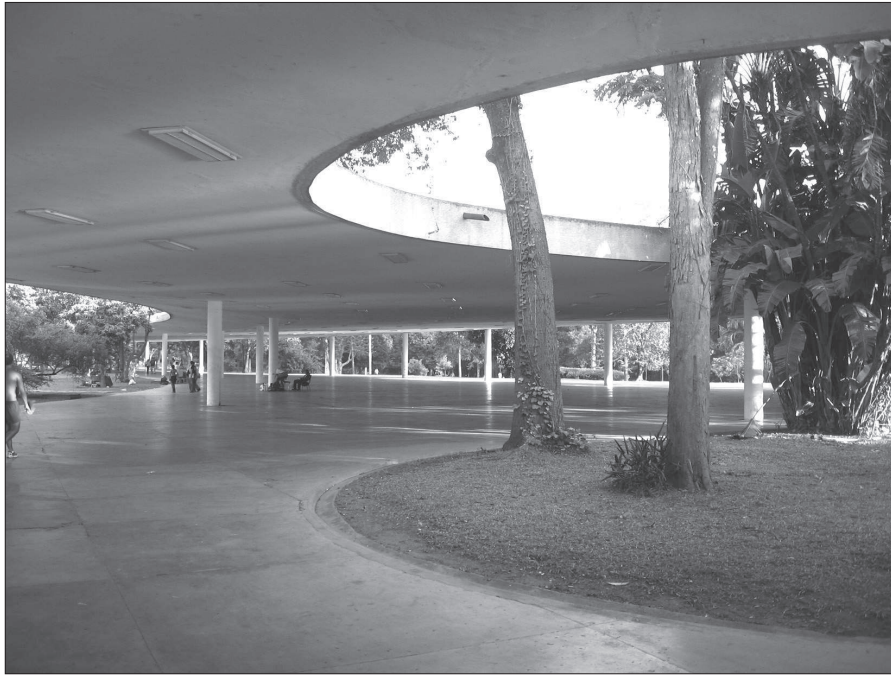
19. Oscar Niemeyer z zespołem, Park Ibirapuera (1951–1955), São Paulo (SP), żelbetowe przekrycia ciągów pieszych łączących pawilony wystawowe