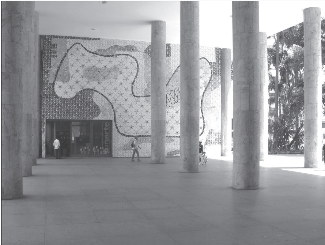
7. Lucio Costa, Oscar Niemeyer z zespołem, Ministerstwo Edukacji i Zdrowia (1937–1943), Rio de Janeiro (RJ), widok kompozycji plastycznej w podcieniu gmachu z wykorzystaniem płytek azulejos (autorzy: Candido Portinari i Paulo Rossi Osir)