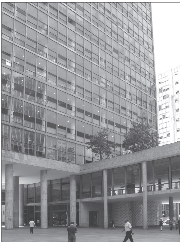
5. Lucio Costa, Oscar Niemeyer z zespołem, Ministerstwo Edukacji i Zdrowia (1937–1943), Rio de Janeiro (RJ), elewacja południowa – przeszklona ściana osłonowa

5. Lucio Costa, Oscar Niemeyer and others, Ministry of Education and Health (1937–1943), Rio de Janeiro (RJ), south facade – glass curtain wall