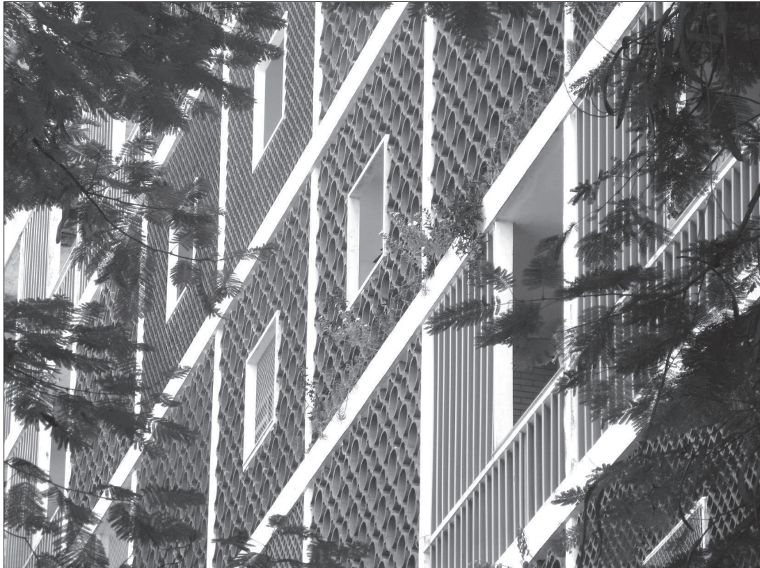
16. Lucio Costa, budynki w zespole mieszkaniowym Parque Guinle (1948–1954), Rio de Janeiro (RJ), detal przesłony z drobnowymiarowych elementów cobogós