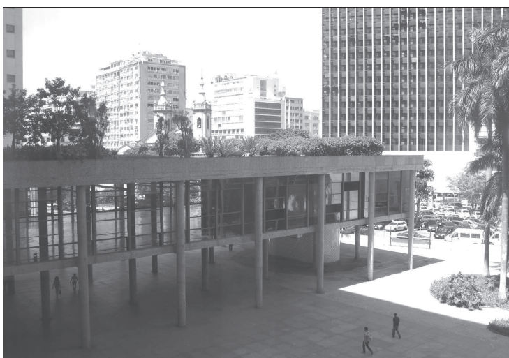
6. Lucio Costa, Oscar Niemeyer z zespołem, Ministerstwo Edukacji i Zdrowia (1937–1943), Rio de Janeiro (RJ), ogród na dachu niższej części budynku (autor: Roberto Burle Marx)

5. Lucio Costa, Oscar Niemeyer and others, Ministry of Education and Health (1937–1943), Rio de Janeiro (RJ), south facade – glass curtain wall