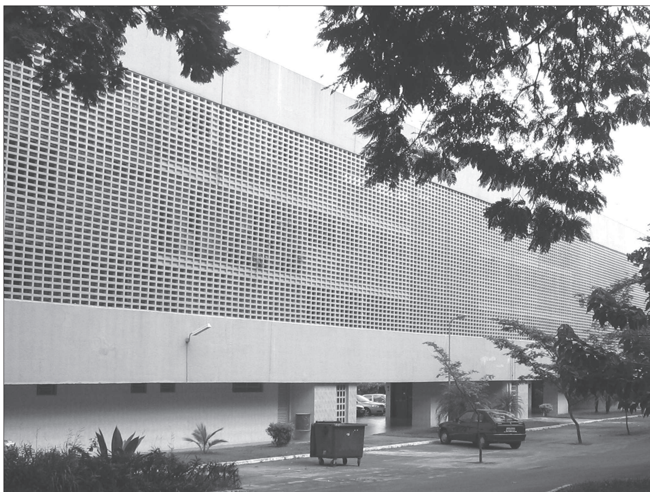
18. Budynki wielorodzinne w jednym z zespołów mieszkaniowych, Superquadra Sul (ok. 1960 r.), Brasilia (DF) 18. Multi-family houses in one of the residential complexes, Superquadra Sul (circa 1960), Brasilia (DF)