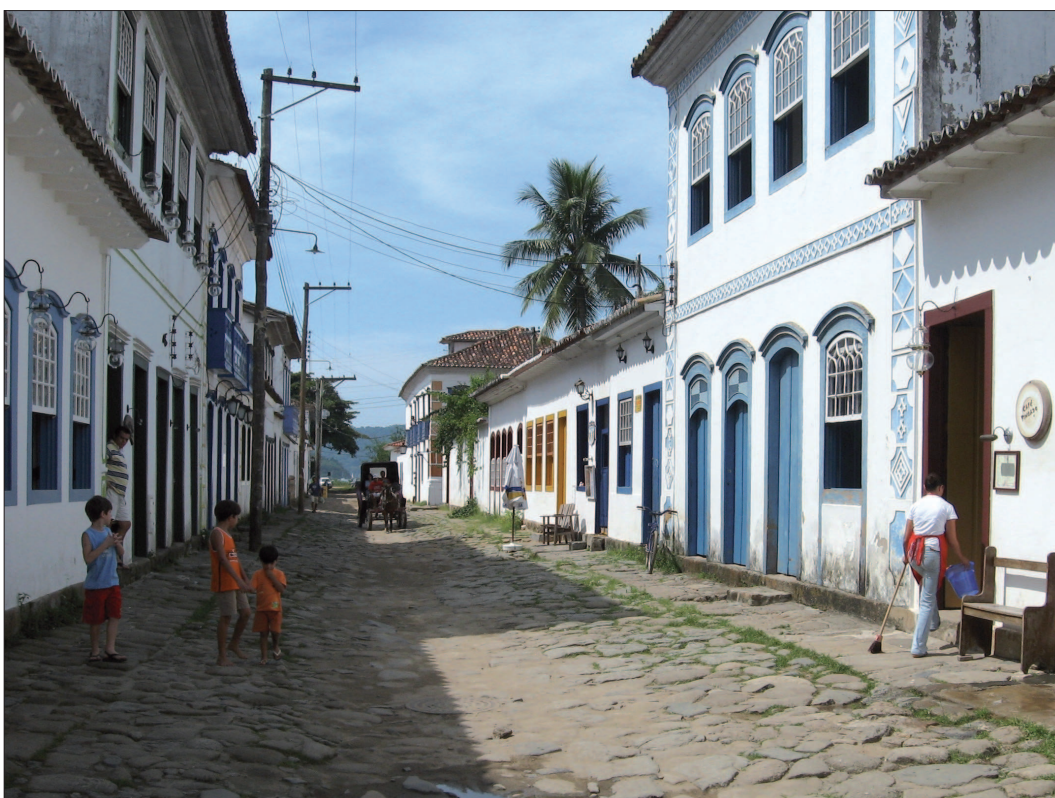
2. Zabudowa Paraty (RJ) – miasta portowego położonego na szlaku transportu złota, wybudowanego w oparciu o sporządzony uprzednio racjonalny plan urbanistyczny (1660 r.) 2. Architecture of Paraty (RJ) – a port town located on the route once used to transport gold. It was built with the use of rational urban planning (1660)