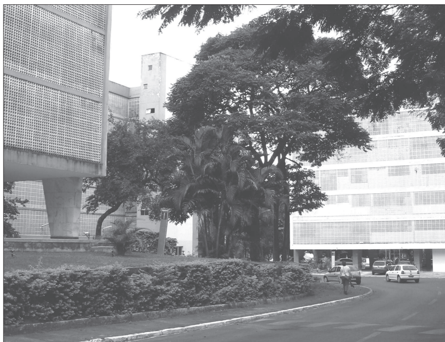
17. Budynki wielorodzinne w jednym z zespołów mieszkaniowych, Superquadra Sul (ok. 1960 r.), Brasilia (DF); fot. autor 17. Multi-family houses in one of the residential complexes, Superquadra Sul (circa 1960), Brasilia (DF); photo by the author