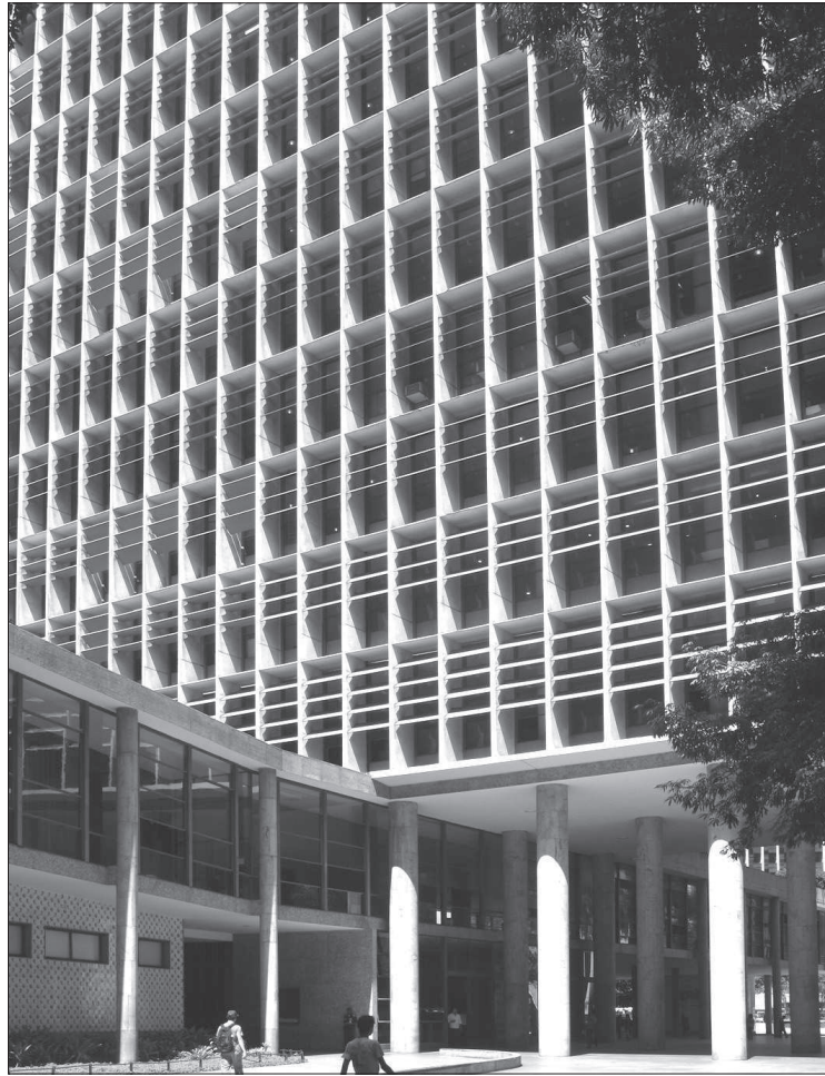
3. Lucio Costa, Oscar Niemeyer z zespołem, Ministerstwo Edukacji i Zdrowia (1937–1943), Rio de Janeiro (RJ), elewacja północna – skrzynekowe brise-soleil z ruchomymi przesłonami