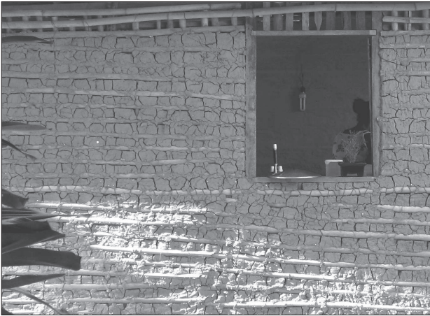
20. Ściana budynku wzniesionego w tradycyjny sposób – ruszt z żerdzi wypełniony narzucaną ziemią, w górnej części, pod okapem, niewypełniony szkielec zapewnia wentylację, wybrzeże Baía da Ilha Grande; fot. autor

20. Wall of a building constructed in a traditional manner – a grillage of wooden poles filled with dirt; the grillage left unfilled in the upper part of the wall, under the ventilation hood, ensures air circulation; the coast of Baía da Ilha Grande; photo by the author