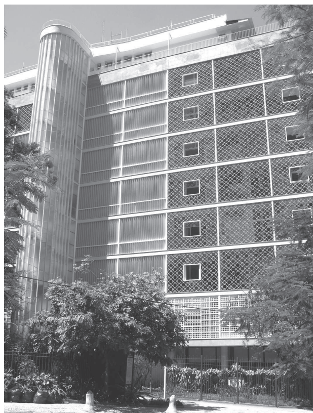
15. Lucio Costa, budynki w zespole mieszkaniowym Parque Guinle (1948–1954), Rio de Janeiro (RJ); fot. autor 15. Lucio Costa, buildings in the Parque Guinle residential complex (1948–1954), Rio de Janeiro (RJ); photo by the author

brazylijskiego na wystawę światową w Nowym Jorku w 1939 roku, już po realizacji pionierskiego obiektu, jakim była wieża ciśnień w Olinda (Pernambuco) z 1937 roku, projektowana przez Fernando Saturnino de Brito i przedwcześnie zmarłego Luiza Nunesa. Była to pierwsza prezentacja brazylijskiej odmiany architektury nowoczesnej, która zwróciła uwagę architektów amerykańskich i europejskich na indywidualny charakter nurtu rozwijającego się w ramach stylu międzynarodowego. Fragment elewacji frontowej pawilonu wykonany został ze skrzynkowych żelbetowych elementów prefabrykowanych. Dziesięć lat później Lucio Costa zastosował cobogós w brawurowy sposób, jako przewodni motyw kształtujący charakter elewacji sześciu budynków zespołu mieszkaniowego Parque Guinle w Rio de Janeiro z lat 1948–1954 (il. 15, 16). Wyraźnie zarysowane, prostokątne pola siatki podziałów elewacji wypełnione są przesłonami z cera-