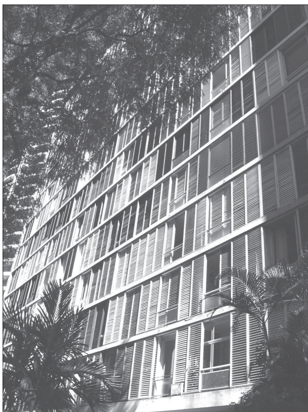
14. Adolf Franz Heep, budynek mieszkalny Lausanne (1953–1958), São Paulo (SP); fot. autor 14. Adolf Franz Heep, the Lausanne residential building (1953–1958), São Paulo (SP); photo by the author