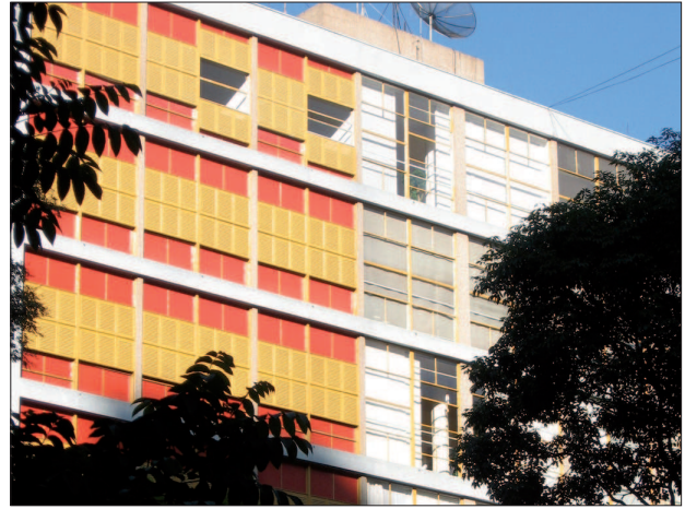
13. João Vilanova Artigas, zespół mieszkaniowy Louveira (1946–1949), São Paulo (SP)

12. João Filgueiras Lima, building of the Pioneiras Sociais foundation in the Sarah Kubitschek hospital complex (1995), Brasilia (DF)