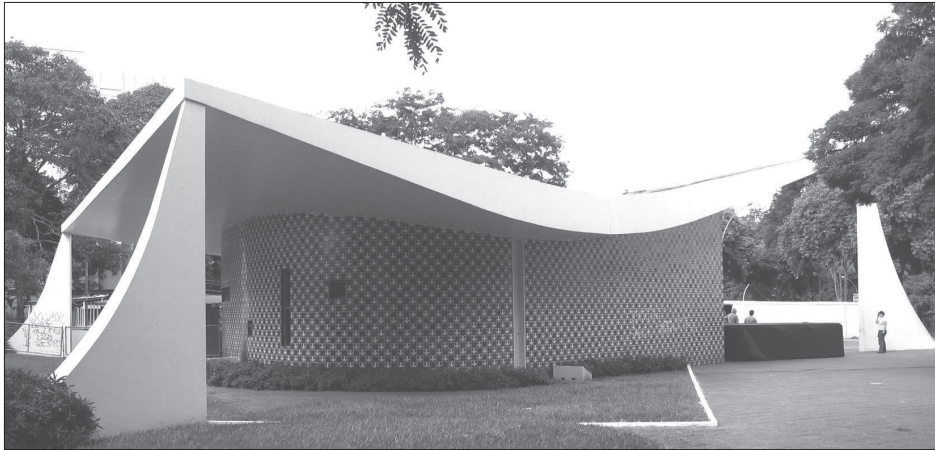
10. Oscar Niemeyer, Kaplica Matki Boskiej Fatimskiej (1957–1958), Brasilia (DF), ściany zewnętrzne licowane płytkami azulejos 10. Oscar Niemeyer, church of Our Lady of Fatima (1957–1958), Brasilia (DF), the outer walls covered in azulejos