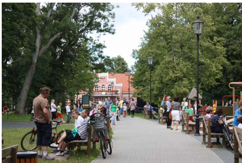
Ryc. 2. Do parku wprowadzono nowe funkcje w postaci rozbudowanych placów zabaw i pawilonu kawiarnianego przyciągające tłumy mieszkańców

licznych terenów, jak i Gdańska, Oliwy zapoczątkowane w XVII w. 18 . Powstanie kalwarii podniosło rangę miasta w lokalnych uwarunkowaniach, jak również dla katolickiej kaszubskiej ludności miało znakomite znaczenie jako ośrodek integrujący kulturowo i religijnie 19 . Rzesze wiernych napływające rokrocznie do miasta nie są objęte statystykami związanymi z turystyką w tym regionie. Pamiętać jednak należy że tradycja pięciu odpustów przyciąga do Wejherowa tysiące wiernych na obchody 20 . Dzięki pozyskanym środkom z zadania „Zachowanie i udostępnienie dziedzictwa Pomorza poprzez utworzenie Parku Kulturowego w Wejherowie” wykonano w 2006 r. gruntowne prace remontowe kaplic kalwaryjskich, wystrój ich wnętrza, drózek oraz iluminację całości zespołu kalwarii.