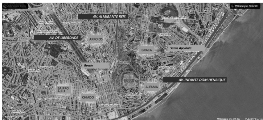
Ryc. 2. Obszar dzielnicy Mouraria z oznaczeniem dzielnic sąsiadujących oraz głównych arterii i węzłów komunikacyjnych (dworce Santa Apolonia i Rossio)

Populacja dzielnicy starzeje się w porównaniu do całego kraju, przy relatywnie większym odsetku młodych ludzi, głównie wśród imigrantów. Mouraria reprezentuje obszar dużej gęstości zaludnienia, gdzie prawie 20% ludności żyje w mieszkaniach przeludnionych. Niski poziom wykształcenia towarzyszy bardzo wysokiemu wskaźnik analfabetyzmu, z najwyższym poziomem wśród populacji kobiet (6,81%), jakkolwiek ze znacznym ogólnym odsetkiem absolwentów szkół: 4,17% w stosunku do całej Lizbony 1,81% i 1,71% dla Portugalii. Stopa bezrobocia wynosi ok. 13% (poziom wyższy dla mężczyzn: 14% niż kobiet: 12,5%). Charakterystyczny jest też duży odsetek