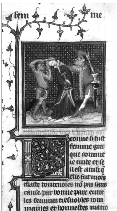
Śmierć Leeny , miniatura z rękopisu paryskiej Bibliothèque Nationale, Richelieu, Mss. Français 598 (anonimowy przekład dzieła Boccaccia, Paryż, XV w.), k. 76

Wydaje się, że Leena była Greczynką. I choć to kobieta mało obyczajna, za łaskawym przyzwoleniem szlachejnych dam i znakomitych królowych chciałbym ją umieścić pośród sławnych niewiast. Nie obiecałem przecież opisywać tylko kobiet przyzwoitych, lecz sławne, bez względu na przyczynę sławy 8 .