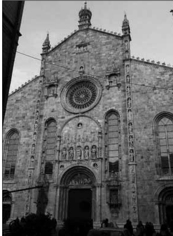
Katedra w Como.