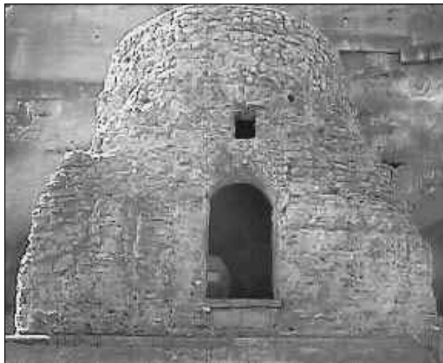
Grób Wergiliusza w Neapolu.