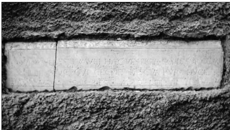
Inskrypcja z Grobu Wergiliusza w Neapolu.