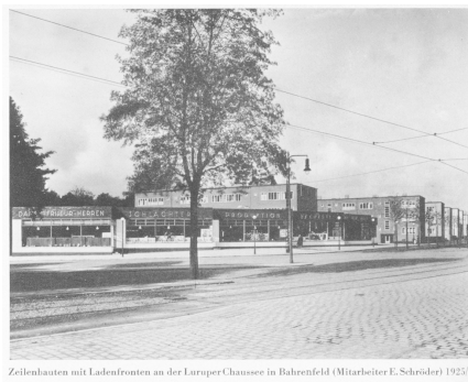
Zeilenhäuten mit Ladenfronten an der Luruper Chaussee in Bahrenfeld (Mitarbeiter E. Schröder) 1928/26