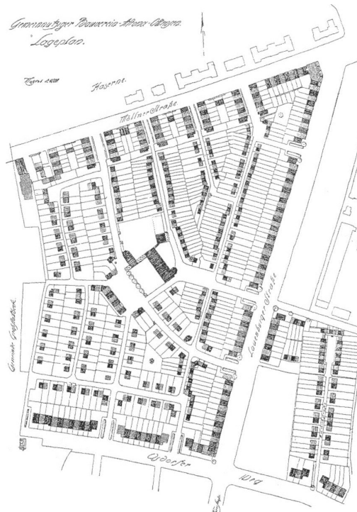
Ryc. 3. Plan rozbudowy miasta-ogrodu Steenkamp w Altonie, 1915, arch. F. Neugebauer Źródło: [ http://books.openedition.org/psorbonne/docannexe/image/525/img-15.jpg ].

pozycji, osiowość, dbałość o kształtowanie wnętrza urbanistycznych, strome dachy kryte dachówką, zabudowa o skali i charakterze bardziej wiejskim niż miejskim – te cechy kompozycji urbanistycznej były raczej negowane przez modernistów awangardowych lub tych reprezentujących styl międzynarodowy, niemniej znakomicie wpisywały się w ideę howardiańską. W planie zabudowy widać dążenie do liniowego kształtowania zabudowy w układzie północno-południowym. Każdy z domów był dwukondygnacyjny, o skromnej, ale wystarczającej dla jednej rodziny powierzchni 70 m 2 . Wszystkie ogródki frontowe miały być obsadzone roślinnością w ten sam sposób, aby manifestować motto tego miasta-ogrodu, które brzmiało: „prostota, równość, przejrzystość i wspólnota” [Michelis 2008] (fot. 2, 3, 4).