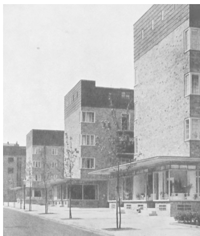
Fot. 5. Zespół mieszkaniowy Helmholtz-Bunsentraße zaprojektowany przez G. Oelsnera według nowoczesnych zasad urbanistyki, 1928. W parterach widoczne przeszklone pawilony usługowe, które przydają lekkości masywnej zabudowie i klinkierowym elewacjom