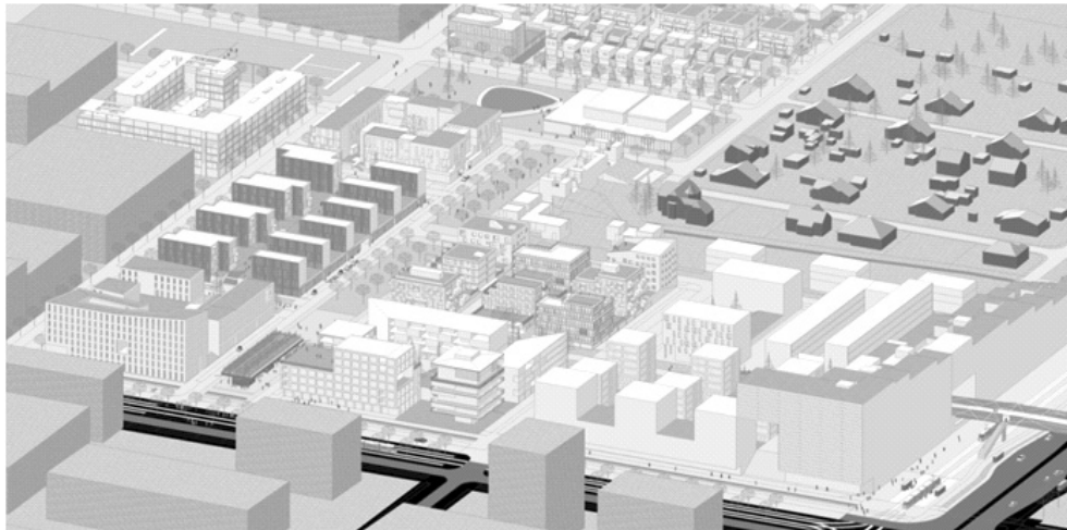
Ryc 3. Zasada kompozycji urbanistycznej założenia Nowe Żerniki z zaznaczonym obecnie realizowanym etapem

Projekty obiektów publicznych wyłonione zostały w otwartych konkursach architektonicznych. Dąży się do budowy bezpiecznej przestrzeni miejskiej odpowiadającej oczekiwaniom wobec domu. Miasto, a nie zbiór fotogenicznych domów – a bez wygrodzeń i monitoringu, ale z wypracowaną całą sekwencją przestrzeni pośrednich: od tych zupełnie prywatnych, przez półprywatne, sąsiedzkie, pół-publiczne i w pełni dostępne. Dzięki zapewnieniu kompletnego pakietu usług dąży się do ograniczenia potrzeby indywidualnej komunikacji samochodowej do innych części miasta. Podobny cel ma też podjęcie kwestii idei miejsca pracy zlokalizowanego w mieszkaniu lub