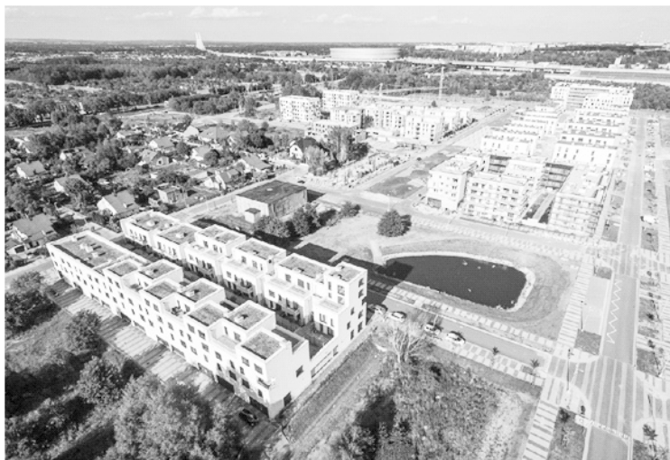
Fot. 1. Obecna faza realizacyjna głównej przestrzeni publicznej Nowych Żernik

w bezpośrednim sąsiedztwie. Odpowiada to na założenie główne, że w proponowanych rozwiązaniach szczególne miejsce zajmie kwestia szeroko rozumianej ekologii i zrównoważonego rozwoju. Obok redukcji zapotrzebowania na komunikację kołową, planowana jest implementacja rozwiązań pasywnych i niskobudżetowych, minimalizujących wydatki eksploatacyjne.