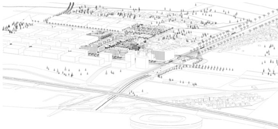
Ryc. 2. Relacja założenia Nowe Żerniki do głównego układu komunikacyjnego

Oznaczało to świadome wybory już na etapie typowania kilku potencjalnych lokalizacji. Pod uwagę brano głównie kryteria przekładające się w skali makro na jakość życia przyszłych mieszkańców i jakość samego osiedla. Zatem istotne było bardzo dobre połączenie wybranego terenu z centrum miasta przez komunikację zbiorową (zwłaszcza szybki tramwaj), a także potencjał, jaki w tym zakresie stwarzają dwie pobliskie lokalne linie kolejowe, mogące w przyszłości działać jako zintegrowany element wielowątkowego systemu komunikacji miejskiej. Niezwykle istotny był także aspekt potencjału istniejących sieci przesyłowych infrastruktury technicznej. Dawał on gwarancję projektowania osiedla na bazie zasilania w czyste, ekologiczne źródła ogrzewania, czy możliwości oszczędzania wód opadowych w zbiornikach retencyjnych. Olbrzymie znaczenie dla ostatecznego wyboru terenu Nowych Żernik miał też aspekt urbanizacyjny, w którym to nowe założenie zablizniało ranę w ciągłej tkance miasta. Wreszcie, wybrany teren będąc w 100% własnością gminy dawał gwarancję uniknięcia wszelkich niepożądanych zjawisk, na czele z praktykami spekulacyjnymi, które bardzo często uniemożliwiają w polskich realiach społeczno-gospodarczych racjonalne działania planistyczne.