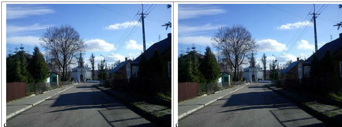
Ryc. 2. Il.3. Powiązania widokowe w przestrzeni miejscowości:

Ryc. 3. a) widok cerkwi w Krynkach, b) widok kościoła w Krynkach, c) widok cerkwi w Dąbrowie, d) otwarcie krajobrazowe z rynku w Sokółce