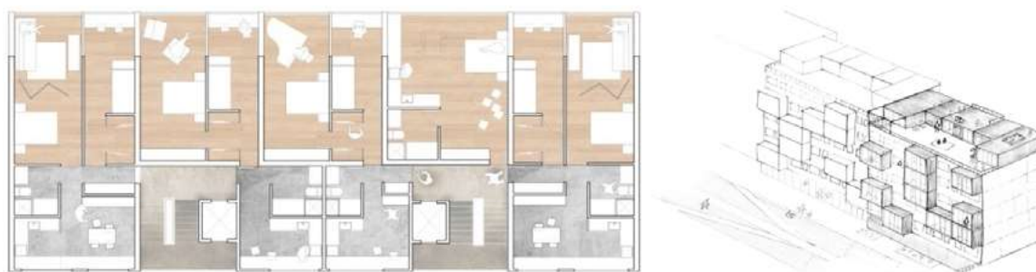
Ryc. 8. Plan budynku w technologii OWT-67 z wprowadzeniem nadbudowy i dźwigów osobowych. Praca studencka.