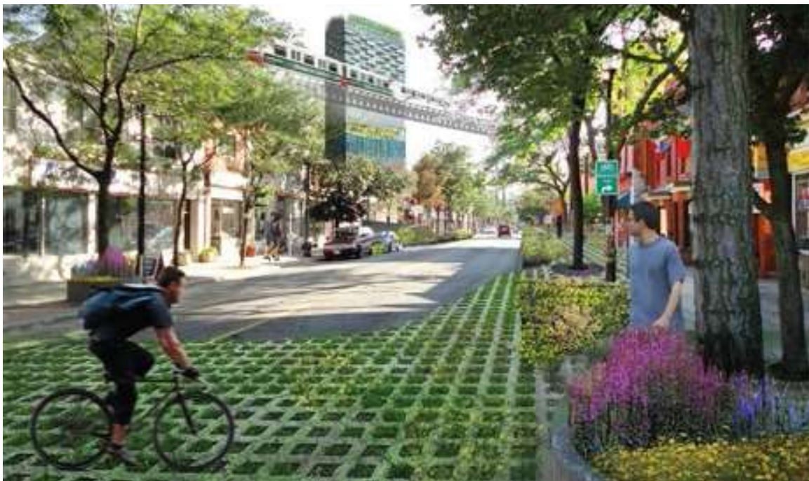
Ryc. 10. Miejska oaza.

Istotnym elementem w przestrzeni publicznej jest projektowanie licznych ścieżek i szlaków komunikacyjnych i spacerowych, odseparowanych od traktów komunikacji kołowej, bezpiecznych, oświetlonych, zadbanych i zaopatrzonych w liczne miejskie oazy 8 , czyli atrakcyjne architektonicznie i przyrodniczo miejsca, gdzie można się