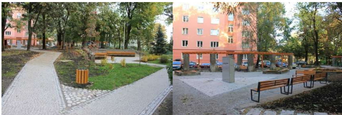
Ryc. 6. Skwer przy ul. Sowińskiego 4 - stan obecny.

Ważna jest również wspomniana wcześniej dostępność do publicznych środków transportu, jak i do samych budynków zamieszkania i innych z którymi użytkownik wchodzi w interakcję. Należy pamiętać o projektowaniu równych bezskokowych nawierzchni, redukować schody i gdzie możliwe zastępować je pochylniami i rampami, dbać o wyraźne wizualne oznaczenia przejść i przeszkód a w budynkach stosować poręcze, pochwyt i antypoślizgowe podłogi. Za przykład usprawnienia komunikacji wewnątrz budynku mogą posłużyć rozwiązania stosowane na osiedlu Ascostaden w Vesteras 7 (Szwecja), gdzie do budynków czterokondygnacyjnych dostawiono zewnętrzne klatki schodowe, a istniejące zastąpiono dźwigami osobowymi. Zainstalowano też liczne