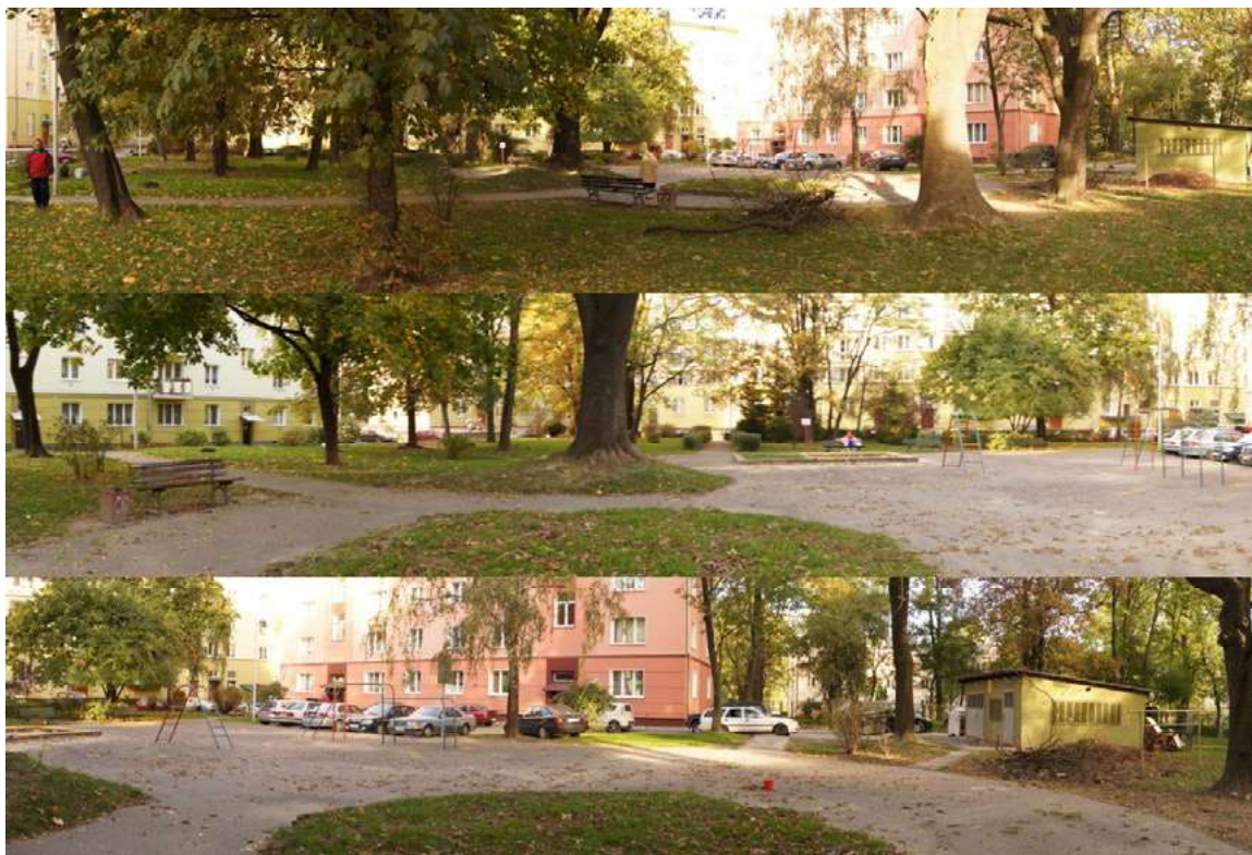
Ryc. 5. Widoki panoramiczne na skwer.