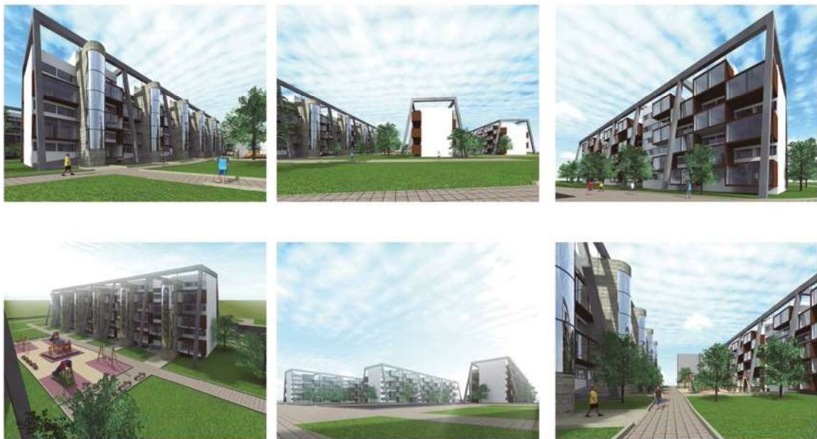
Ryc. 9. Widok budynku w technologii OWT-67 z wprowadzeniem zewnętrznych dźwigów osobowych. Praca studencka.