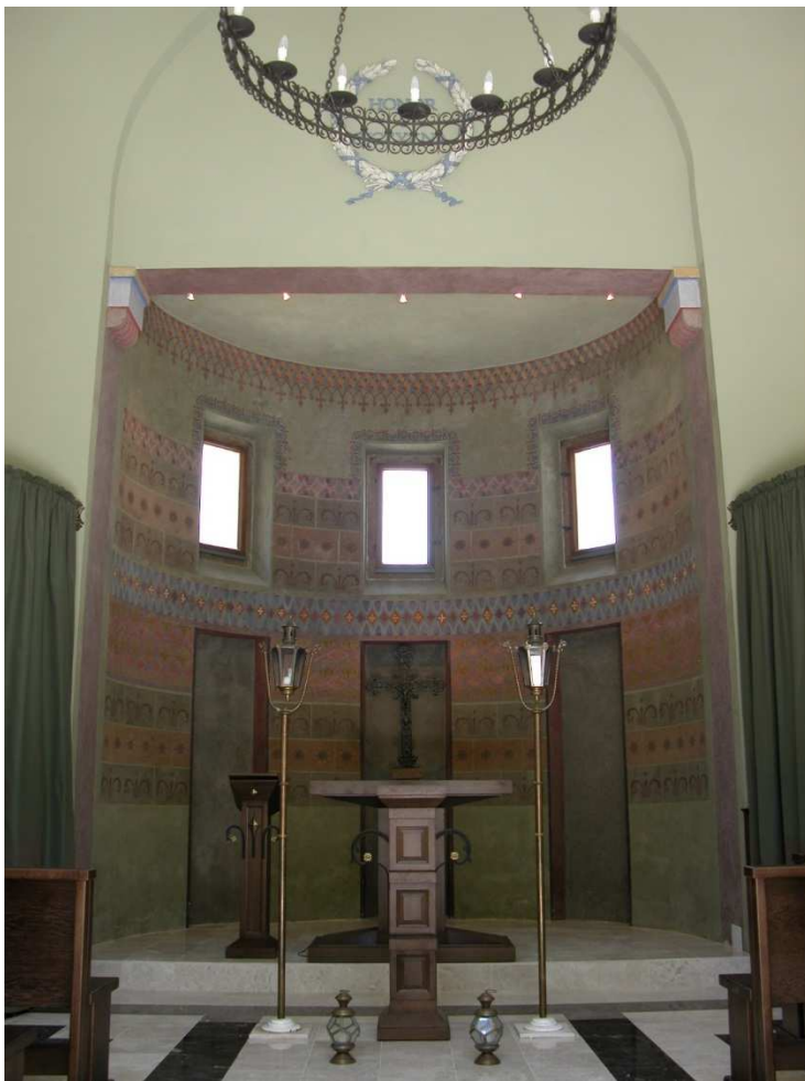
Ryc. 4. Dekoracja wnętrza kaplicy po pracach konserwatorskich

Fig. 3.