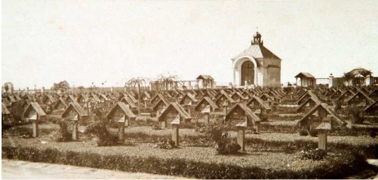
Ryc. 3. z albumu „Valka 1914-1918”

Fig. 3. Phot. auth.. F.Lala from the album „Valka 1914-1918” gained by Lubelskie.Museum