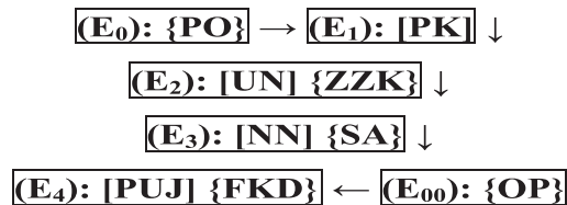
Ryc. 1. Cykl powstawania i utrwalania jednostki (chremat)onimicznej w sferze marketingu

zazwyczaj ograniczają się do konwencjonalnego wpisu nazwy do rejestru sądowego, ale mogą przybierać charakter uroczysty, formalny bądź nieformalny (np. „chrzty” statków, samochodów, lotnisk). W etapie czwartym ( E_4 ) wskazać należy na przejście nazwy do praktycznego użycia w języku [PU], łączonego z wieloaspektowymi faktami komunikacyjnymi i dyskursywnymi {FKD}, aby wreszcie ponownie wrócić w zamkniętym cyklu do [PK] i obiektu pozajęzykowego {OP} ( E_{00} ), denotowanego przez utrwalany chrematonim. Schematycznie cały cykl przedstawia się zatem następująco: