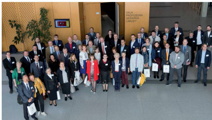
4. Zdjęcie zbiorowe uczestników konferencji 20 września 2017 r. przed aulą im. Gerarda Labudy.

Ideą konferencji zatytułowanej „ Meministi? Pamięć i niepamięć w świecie starożytnym, świat starożytny w pamięci i niepamięci ” 3 było zaproszenie do dyskusji nad zagadnieniami pamięci i niepamięci w świecie starożytnym. Oba zjawiska