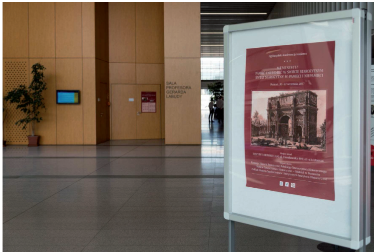
1. Hol Collegium Historicum . W tle aula im. Gerarda Labudy.

W dniach 20–22 września 2017 r. odbyła się kolejna ogólnopolska konferencja starożytnicza organizowana przez Komisję Historii Starożytnej przy Zarządzie Głównym Polskiego Towarzystwa Historycznego. To cykliczne wydarzenie szczyli się już niemal czterdziestoletnią tradycją 1 . Tegoroczna konferencja miała miejsce w Uniwersytecie im. Adama Mickiewicza w Poznaniu, w nowym gmachu Instytutu Historii UAM na Morasku ( Collegium Historicum ). Organizatorami wydarzenia były trzy podmioty: Komisja Historii Starożytnej przy Zarządzie Głównym PTH