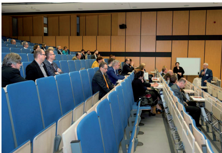
11. Dyskusja po pierwszej sesji plenarnej.