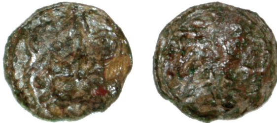
Ryc. 2. Halerz z Madonną z Dzieciątkiem z cmentarzyska Salwatora we Wrocławiu, Fbg 648; wg Książek 2010, nr katalogu 56, średnica 11 mm, waga 0,21 g. Skala ok. 3:1

Znaleziska halerza z Madonną są bardzo rzadkie. W inwentarzu monet, zawierającym odkrycia do 1995 r., opublikowanym przez Stanisławę Kubiak i Borysa Paszkiewicza, wystąpiły zaledwie trzy skarby, w których znajdowały się halerze typu Fbg 650 (282), 648 (283), 649 (280). Są to: skarb z Pokoju (woj. opolskie) datowany na XV w., gdzie wystąpił jeden egzemplarz tej monety, skarb z Wilczkowic (woj. dolnośląskie) z 2. połowy XV w. — tutaj było już łącznie 290 halerzy z Madonną — i skarb z Nasali (woj. opolskie) z połowy XV w., z sześcioma egzemplarzami typu Fbg. 648 3 . Typ 648 odnaleziony został również podczas badań archeologicznych prowadzonych w latach 2005-2008 r. we Wrocławiu na Placu Czystym (Ryc. 2) na cmentarzysku przy dawnym kościele ewangelickim Salwatora (Zbawiciela). Znajdował się w zasypisku jamy grobowej (grób nr 234) z 2. połowy XVI w. należącej prawdopodobnie do pochowanej tam kobiety. Cmentarz został założony w 1541 r., a funkcjonował od 1542 r., z czego wynika że moneta została wrzucona do grobu ponad sto lat od czasu funkcjonowania jej w obiegu 4 .