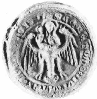
Ryc. 9. Pieczęć Lubina z XIV w., wg Hupp 1898, s. 85

Natomiast na pieczęciach miasta Lubina, którego patronką również była Matka Boska, od XIV w. Dzieciątko stale siedzi przy prawym ramieniu (Ryc. 9), a dopiero w 1492 r. użyto przeciwnego układu 26 . Halerze lubińskie z XV w. 27 powtarzają motyw lubińskich XIV-wiecznych pieczęci (Fbg 585, 586) (Ryc. 3).