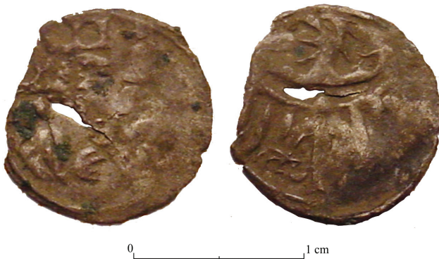
Ryc. 5. Halerz XV-wieczny z Madonną z Dzieciątkiem z warowni w Tarnowie Jeziernym, wg Boguszewicz, Nowakowski, Pozorski 2001, s. 400.