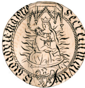
Ryc. 8. Pieczęć miejska części cieszyńskiej Głogowa z przedstawieniem Madonny z Dzieciątkiem i tarczy herbowej z Orłem dolnośląskim poniżej; wg Minsberg 1853, Taf. I/ IV

Natomiast na pieczęciach miasta Lubina, którego patronką również była Matka Boska, od XIV w. Dzieciątko stale siedzi przy prawym ramieniu (Ryc. 9), a dopiero w 1492 r. użyto przeciwnego układu 26 . Halerze lubińskie z XV w. 27 powtarzają motyw lubińskich XIV-wiecznych pieczęci (Fbg 585, 586) (Ryc. 3).