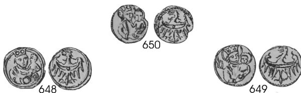
Ryc. 1. Trzy typy haleryzy z przedstawieniem NMP z Dzieciątkiem i Orłem dolnośląskim, wg Friedensburg 1931, nr 283; Friedensburg 1887, nr 650 (282), 648 (283), 649 (280)

Wśród typów piętnastowiecznych haleryzy przypisywanych przez Ferdinanda Friedensburga 1 miastu Głogów znajdują się monety z przedstawieniem popiersia Madonny z Dzieciątkiem na lewym ramieniu (heraldycznie) na awersie i Orłem dolnośląskim z przepaską, na wprost, z głową w lewo na rewersie (Ryc. 1).