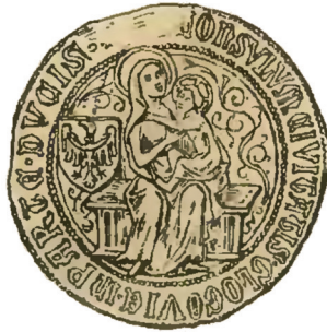
Ryc. 7. Pieczęć miejska części książęcej Głogowa z przedstawieniem Madonny z Dzieciątkiem i Orłem dolnośląskim na tarczy z 2. połowy XIV w., wg Saurma-Jeltsch 1870, Taf. III, nr 31