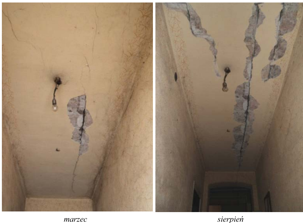
Fot. 1. Przykład zmiany stanu uszkodzenia stropu DMS w klatce schodowej budynku podlegającego oddziaływaniom górniczym (Florkowska i in. 2016)

Na fotografii 1 przedstawiono przykład zmiany intensywności uszkodzeń powstałych w stropie budynku wielorodzinnego poddanego oddziaływaniu górniczych rozpełzań podłoża. Zmianę obserwowano na przestrzeni miesięcy ujawniania się wpływów głównych eksploatacji górniczej realizowanej w rejonie budynku.