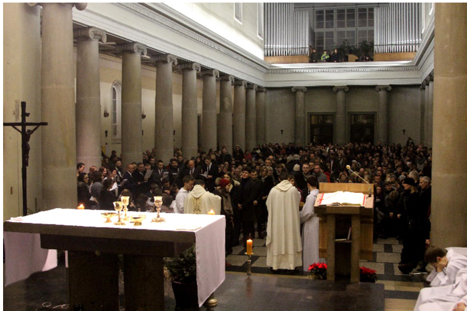
Fot. 4. Kościół Dominikanów – Pasterka

Ponieważ wskaźnik dominicantes w poszczególnych kościołach w kolejnych latach wahał się, konieczne było, aby dane wejściowe dla każdej z parafii zostały uśrednione w okresie 2014–2016 6 . Podano też kierunek zmian: