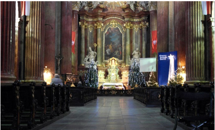
Fot. 2. Fara Poznańska, fot. własna.