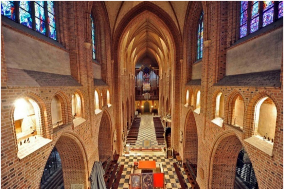
Fot. 1. Katedra Poznańska