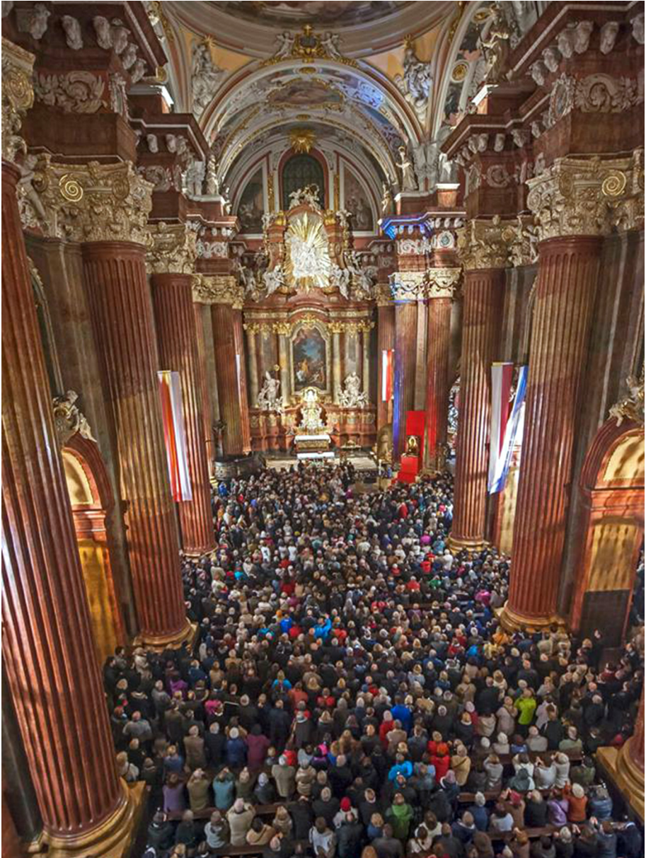
Fot. 5. Fara – uroczystości z okazji 1050-lecia Chrztu Polski [ https://www.facebook.com/farapoznan/photos/a.1565231717021697/1726796100865257/?type=3&theater ; dostęp: 2.11.2018]