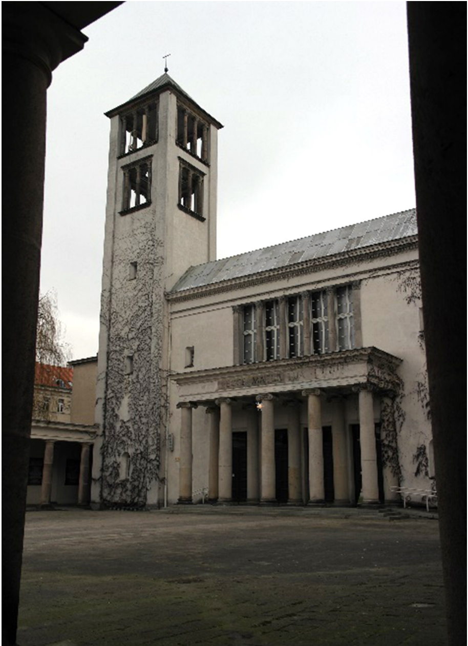
Fot. 3. Kościół Dominikanów, fot. własna.