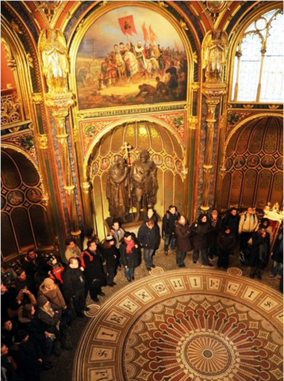
Fot. 6. Katedra – Europejskie Spotkanie Młodych Taizé 2009/2010

[ https://www.facebook.com/duszpasterstwo.mlodych20na30/photos/a.10150313782126375/10150313783301375/?type=3&theater ; dostęp: 2.11.2018]