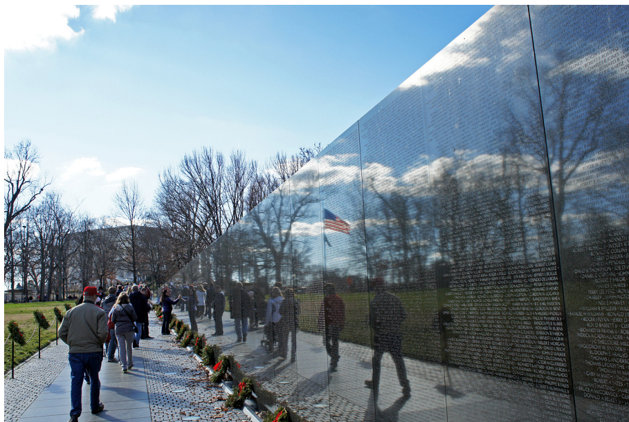
Fot. 1. Vietnam Veterans Memorial

Vietnam Veterans Memorial jest przykładem bardzo spójnej i prostej struktury, która odbija się w interpretacji porządku, rzeczy i charakteru. Czas jest tutaj symbolem upamiętnienia, a światło tworzy grę z widzem poprzez