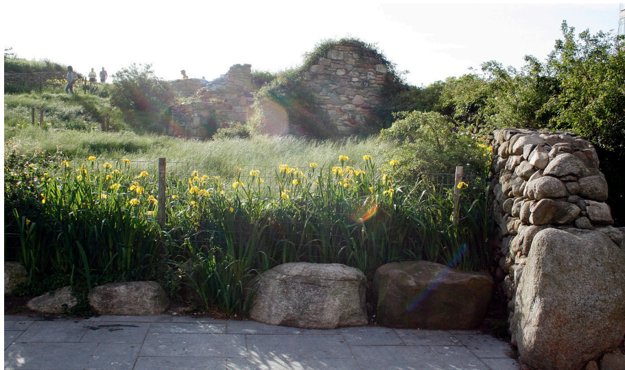
Fot. 6. Irish Hunger Memorial