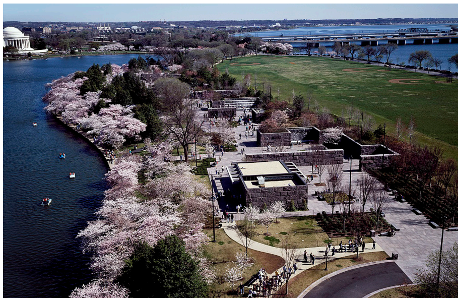
Fot. 2. Franklin Delano Roosevelt Memorial

Jest to drugi tak znaczący pomnik wśród innych Mall (fot. 2). Projektant, Lawrence Halprin, został wybrany do tego zadania w 1974 r. Głównym tematem jest woda, ma ona zadanie symboliczne i praktyczne. Roosevelt kochał wodę, żeglowanie po morzu, stała się ona też poniekąd przyczyną jego