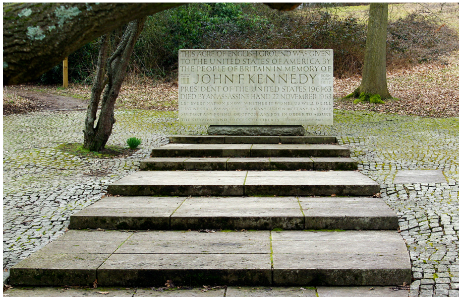
Fot. 3. Kennedy Memorial