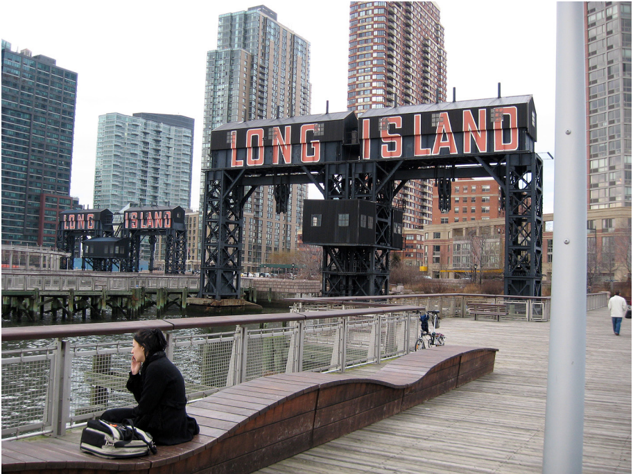
Fot. 5. Gantry Plaza State Park