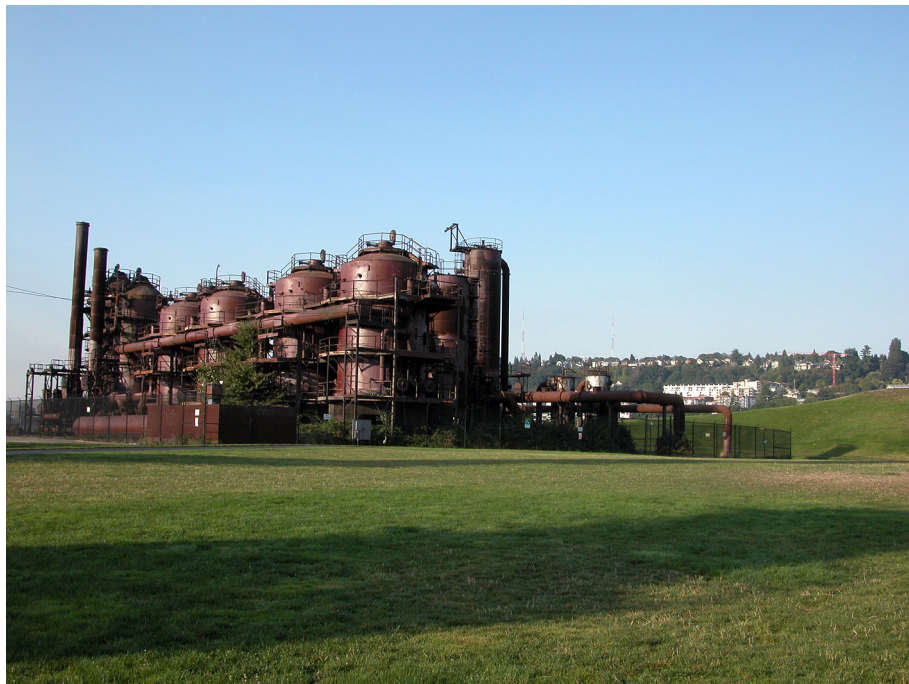
Fot. 4. Gas Work Park