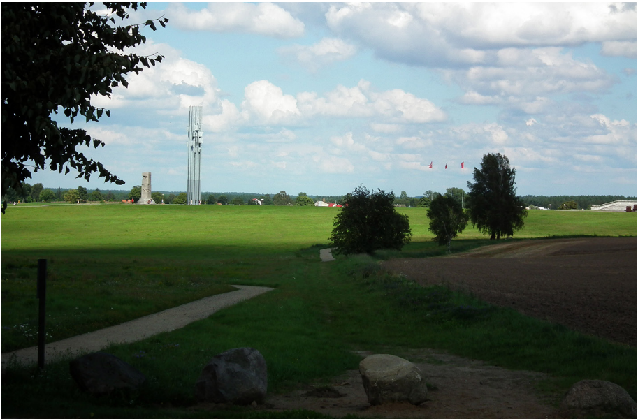
Fot. 7. Pola Grunwaldzkie

Jest to pomnik historii – podlega zatem ochronie ze względu na szczególne wartości historyczne, przestrzenne, materialne i niematerialne (fot. 7). Zwycięstwo wojsk Jagielly nad zakonem krzyżackim stało się symbolem i wartością narodową niezwykle trwale zapisaną w świadomości Polaków. Co roku gmina, Związek Harcerstwa Polskiego, „Wspólnota Drużyn Grunwaldzkich” i bractwa rycerskie 15 lipca organizują Dni Grunwaldu. Przy pomniku odbywają się uroczystości, jednak największą atrakcją jest inscenizacja bitwy, w której udział biorą bractwa rycerskie z Polski oraz zagranicy. Pamięć zostaje pobudzona do życia.