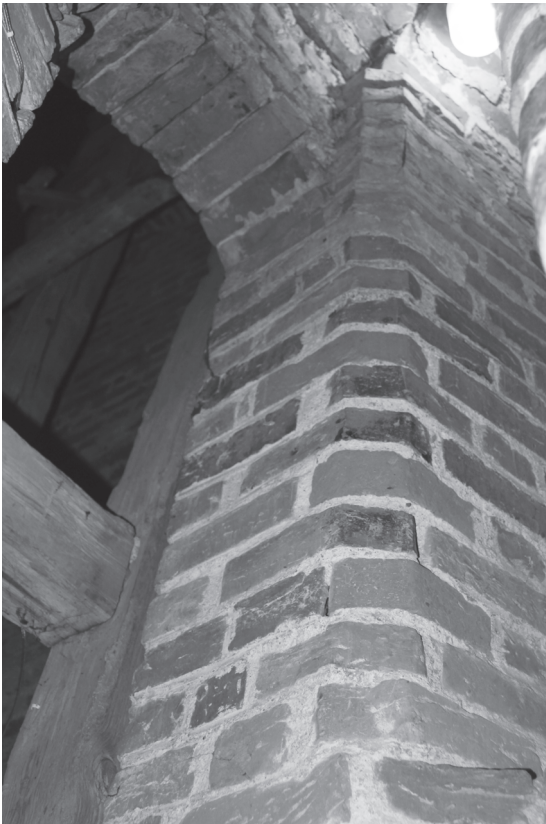
4. Zamurowane przezrocze empory – widok z wnętrza empory.