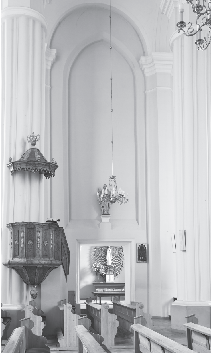
3. Zamurowane przezrocze empory nad dawną zakrystią. Widok z wnętrza kościoła.