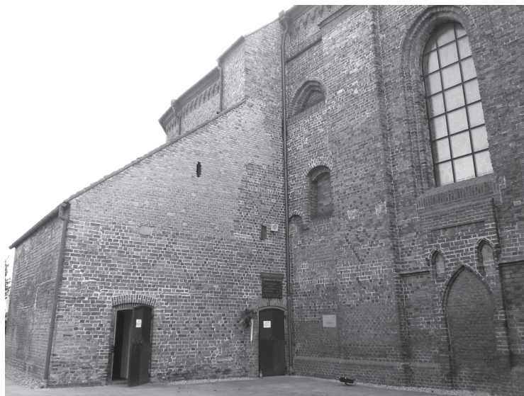
2. Kościół parafialny w Kórniku. Widok od północnego zachodu na dawną zakrynię (obecnie kaplica Wierzysej Adoracji) i pozostałości obu empor.