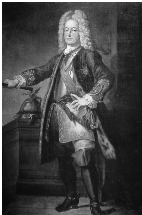
Il. 6. Stanisław Leszczyński (1677-1766), naśladowca Jeana Baptiste'a van Loo, 2. ćw. XVIII w.