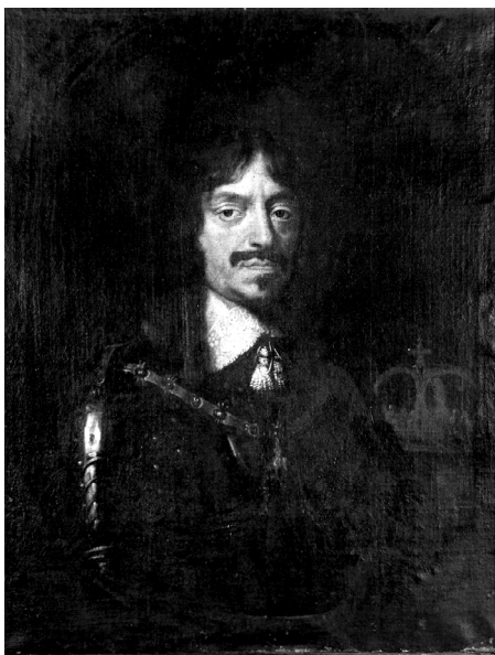
Il. 3. Jan II Kazimierz Waza (1609-1672), malarz gdański, ok. 1650 r.