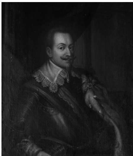
Il. 14. Gustaw II Adolf Waza (1594-1632), ok. 1620 r.