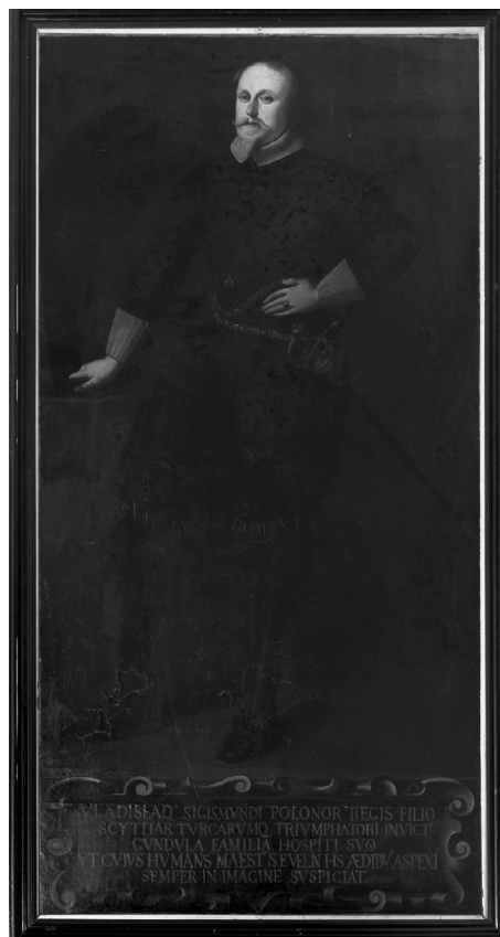
Il. 2 Władysław IV Waza (1595-1648), malarz włoski, po 1624 r.