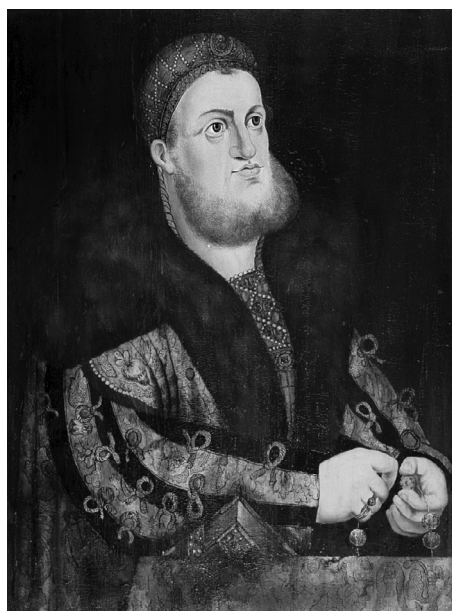
Il. 12. Fryderyk III Mądry Wettyn (1463-1525), król Lucasa Cranacha St., ok. 1510 r.