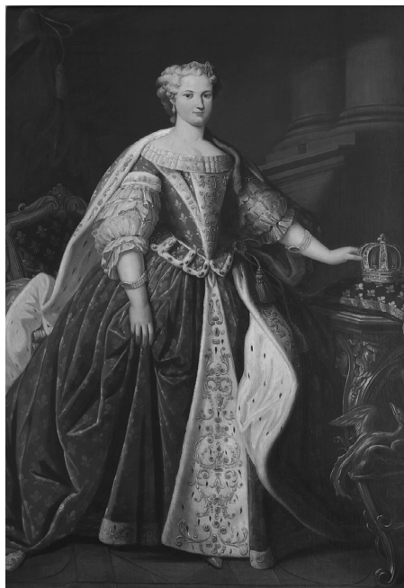
Il. 7. Maria Leszczyńska (1703-1768), naśladowca Jeana Baptiste'a van Loo, 2. ćw. XVIII w.