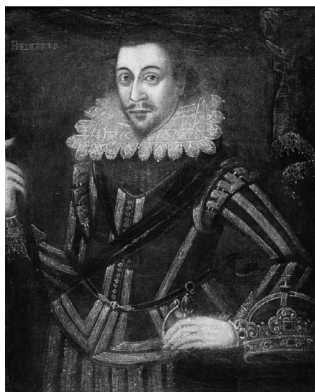
Il. 13. Fryderyk I, (1596-1632), ok. 1620 r.