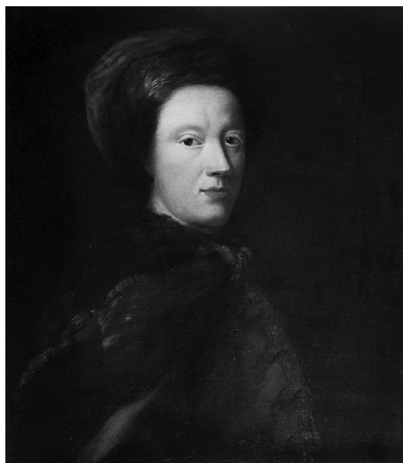
Il. 5. Aleksander Sobieski (1677-1714), mal. Jan Kupecký, po 1700 r.