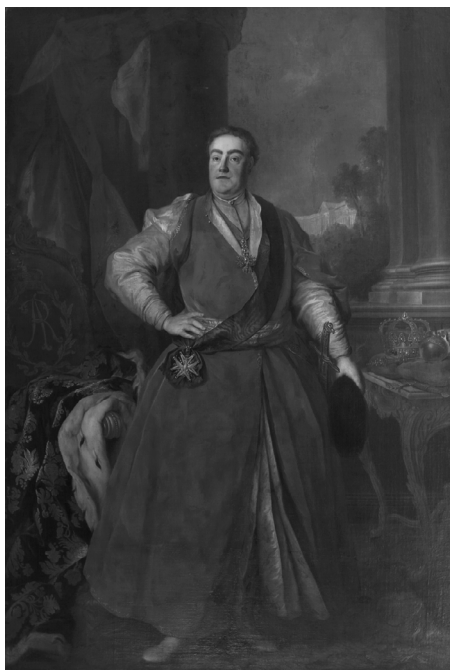
Il. 8. August III (1696-1763), warsztat Louisa de Silvestre'a, po 1737 r.