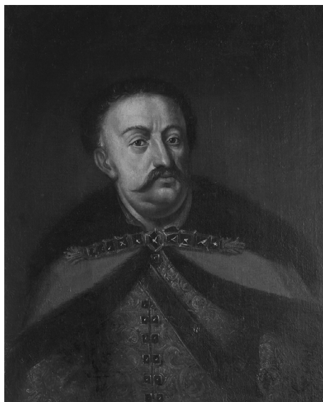
Il. 4. Jan III Sobieski (1629-1696), malarz polski, 4. ćw. XVII w.