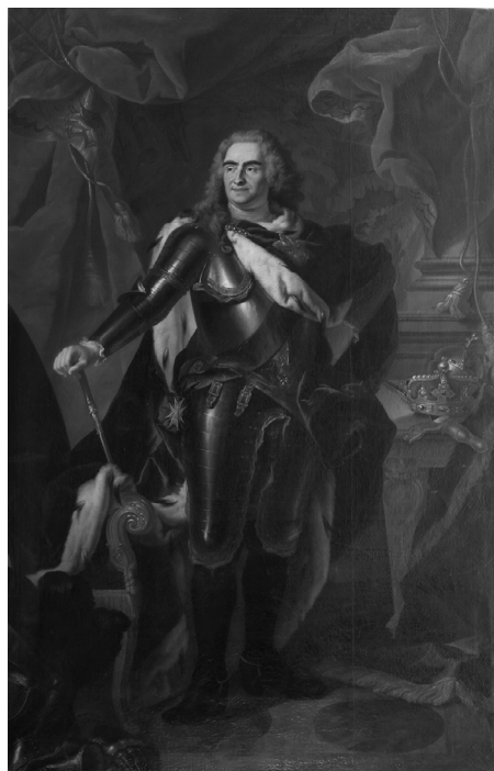
Il. 9. August II (1670-1733), warsztat Louisa de Silvestre'a, po 1718 r.