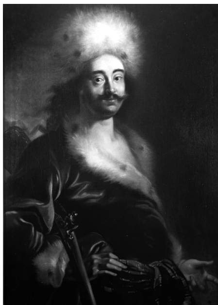
Il. 16. Piotr I Wielki (1672-1725), mal. Jan Kupecký, 1711 r. lub 1712 r.