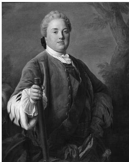
Il. 10. Fryderyk Christian Wettyn (1722-1763), mal. Pietro Rotari, 1755 r.