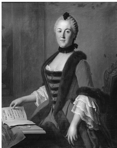
Il. 11. Maria Antonia Wittelsbach (1724-1780), mal. Pietro Rotari, 1755 r.