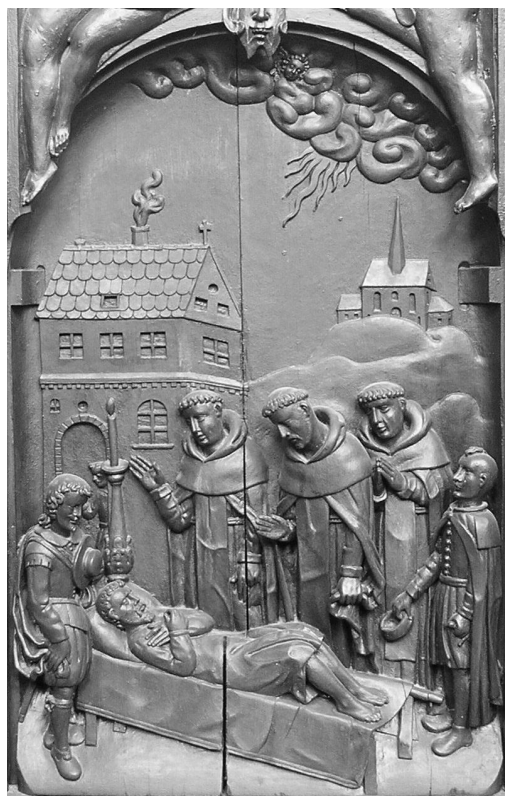
II. 14. Św. Jacek wskrzesza umarłego. Poznań, kościół podominikański.