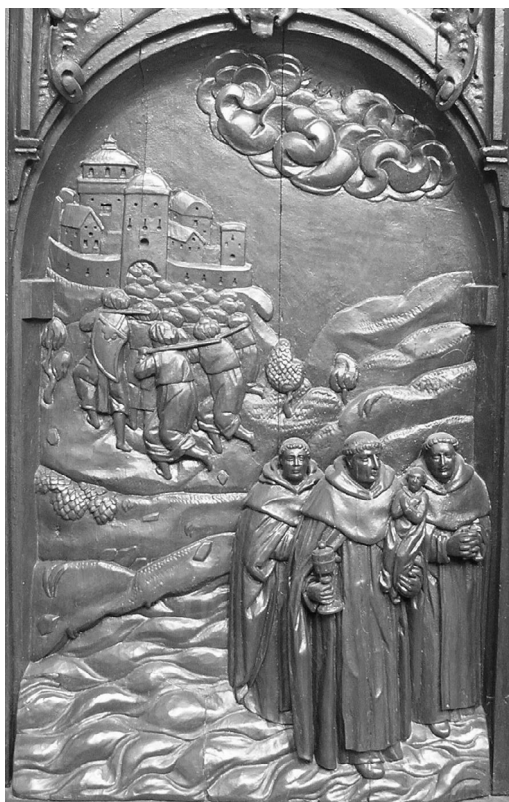
Il. 11. Ucieczka przed Tatarami z Kijowa. Poznań, kościół poddominikański.