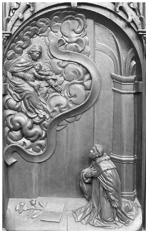
Il. 8. Matka Boska ukazuje się św. Jackowi. Poznań, kościół poddominikański.