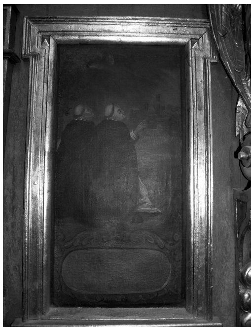
Il. 17. Uratowanie plonów od gradobicia. Klimontów, kościół poddominikański.