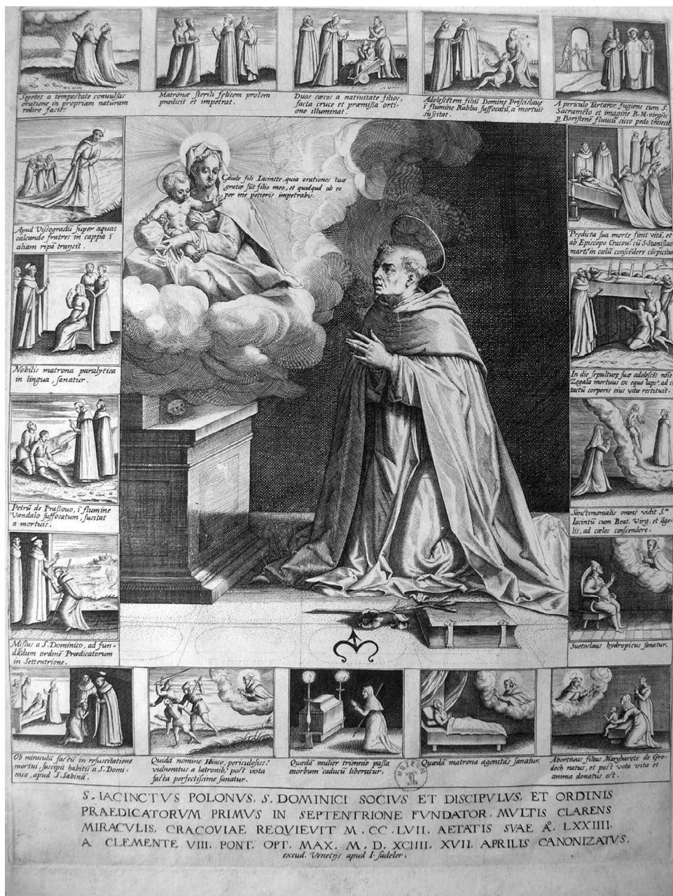
II. 4. Jan Sadeler, Żywot św. Jacka , miedzioryt. Wenecja, przed 1600. Kraków, Muzeum Czartoryskich