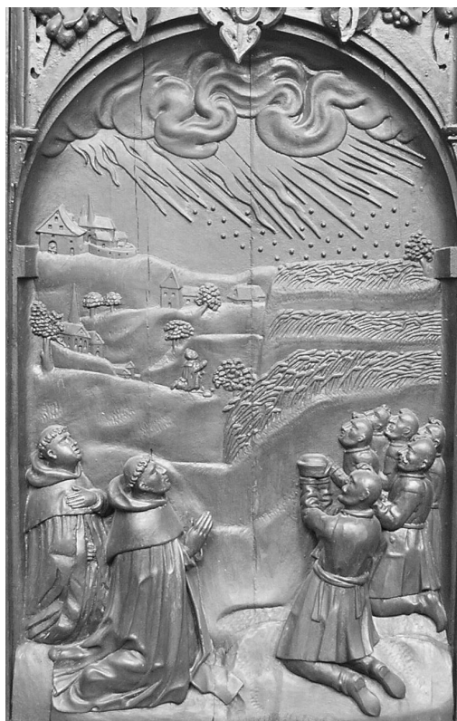
Il. 12. Uratowanie zasiewów od gradobicia. Poznań, kościół poddominikański.