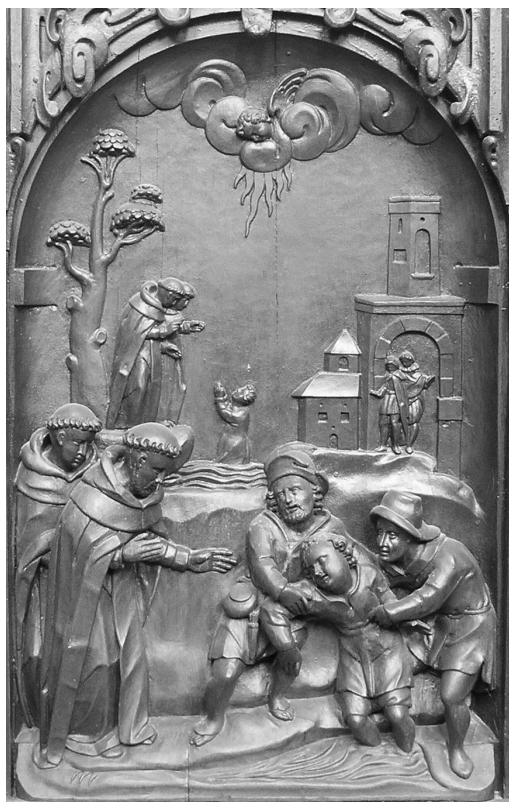
II. 9. Wskreszenie Piotra z Proszowa. Poznań, kościół poddominikański.