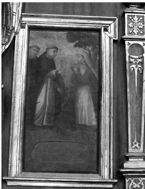
Il. 19. Św. Jacek przepowiada bezpłodnej kobiecie potomstwo. Klimontów, kościół poddominikański.