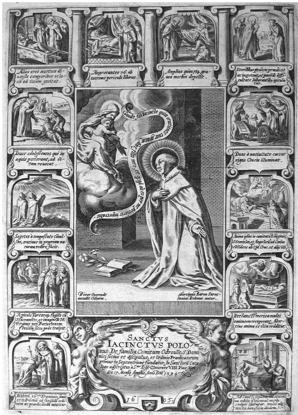
II. 5. Autor nieznany, Żywot św. Jacka , miedzioryt, Peter Overadt (nakł.), Kolonia 1605. Biblioteka Naukowa PAU i PAN w Krakowie