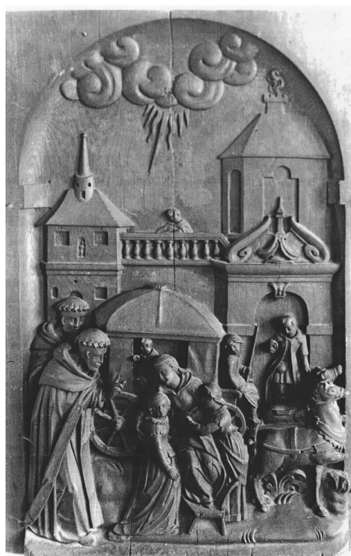
II. 10. Uzdrowienie sparaliżowanej kobiety. Poznań, kościół poddominikański. Obecnie Biblioteka Kórnicka PAN