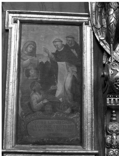
Il. 18. Uzdrowienie niewidomych bliźniąt. Klimontów, kościół poddominikański.