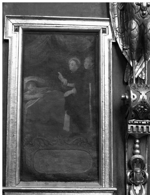
Il. 21. Św. Jacek ratuje konającego. Klimontów, kościół poddominikański.