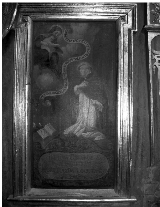
Il. 15. Matka Boska ukazuje się św. Jackowi. Klimontów, kościół poddominikański, ok. 1620-1640.