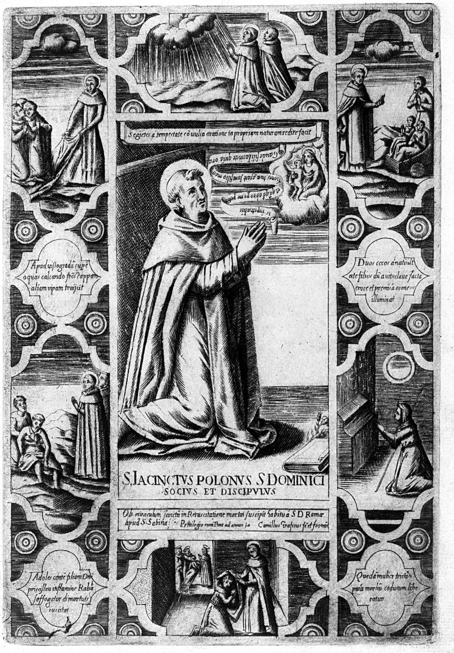
Il. 3. Camillo Graffico, Żywot św. Jacka , miedzioryt. Rzym, ok. 1594/1595. Kraków, Muzeum Czartoryskich