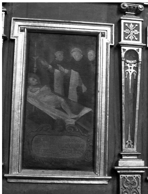
Il. 20. Wskrzeszenie zmarłego. Klimontów, kościół poddominikański.