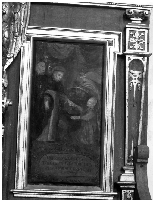
Il. 22. Uzdrowienie chorego. Klimontów, kościół poddominikański.