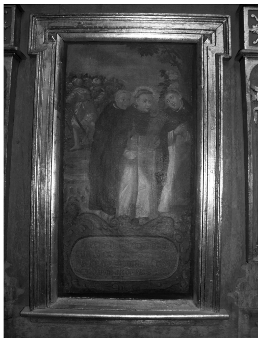
Il. 16. Ucieczka przed Tatarami z Kijowa. Klimontów, kościół poddominikański.