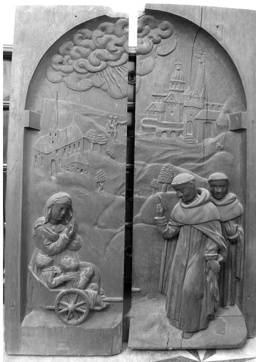
II. 13. Uzdrowienie niewidomych bliźniąt. Poznań, kościół podominikański. Obecnie Biblioteka Kórnicka PAN.