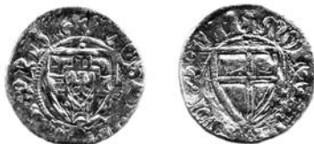
Ryc. 11. Jemiołowo, gm. Olsztynek. Szeląg Henryka v. Plauen. Skala 1:1

Vossb. 587, Av., 591–592 Rv., 1,54 g (ryc. 11).