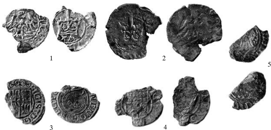
Ryc. 15. 1–5. Żukowo, gm. Naruszewo. Skala 1:1