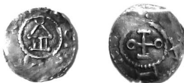
Ryc. 2. Zakroczym — okolica. Denar Ottona III. Skala 1:1

Szwabia , Otto III (983–1002), denar, Konstancja, Dbg 1010 (ryc. 2).