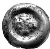
Ryc. 7. Czładź, pow. Będzin. Brakteat morawski Wacława II. Skala 1:1