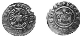
Ryc. 14. Jurzynek, gm. Nowe Miasto. Półgrosz Zygmunta I. Skala 1:1

0,86 g; 17,8 × 18,6 mm; 0°; ślad powtórnego uderzenia stempla w dolnej części Av., wyszczerbiona krawędź (ryc. 14).