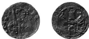
Ryc. 4. Gródek, gm. Hrubieszów, denar Fryderyka I Barbarossy. Skala: 1:1