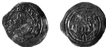
Ryc. 5. Gródek, gm. Hrubieszów, fenig biskupstwa Freising(?). Skala 1:1