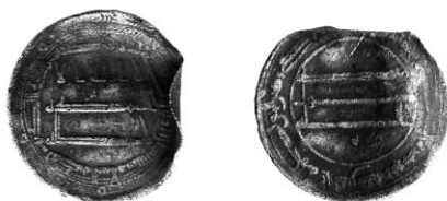
Ryc. 1. Mały Płock, gm. loco. Dirhem kalifa Harun ar-Raszida. Skala 1:1

M.: „na polu przy samym grodzisku”, prawdopodobnie na terenie wczesnośredniowiecznej osady (st. 2a). D.: wiosna 2007 r. Ok.: nieznanne. L.: 1 moneta. Zb.: znalazcy (ryc. 1).