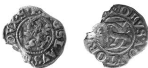
Ryc. 16. Suchań, gm. loco . Podwójny szeląg Bogusława XIV. Skala 1:1

Rv.: DEVS.ADIVTOR.M[\]S ( Deus adiutor meus ), skrzyżowane haki, splecione DS rozdziela datę (ryc. 16).