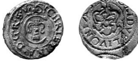
Ryc. 36. Chełm, m. pow. Szeląg inflancki Krystyny. Fot. Artur Orzechowski. Skala 1:1

Inflanty , Krystyna (1632–1654), szeląg 1650–1654, Ryga, Mrow. 649–653 (Ryc. 36).