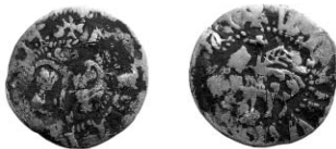
Ryc. 12. Magilëü (Mohylew) obl., gote (ørtug), 1. połowa XV wieku. Skala 1:1

Visby , gote (ørtug), 1. połowa XV w. (ryc. 12).