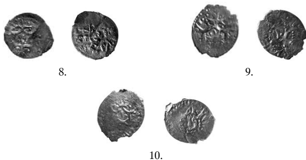
Ryc. 8–10. Żitomir (Żytomierz), oblasť. Monety srebrne Włodzimierza Olgierdowicza. Skala 2:1