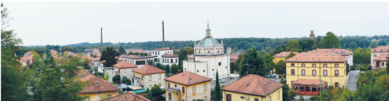
Il.1. Panorama osiedla „Crespi d’Adda” z punktu widokowego, 2015

Ill.1. Panoramic view of „Crespi d’Adda”, 2015