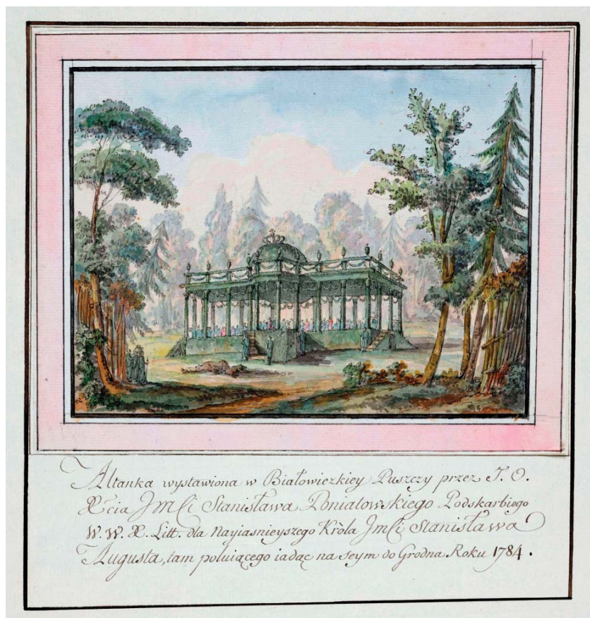
1. Altana do polowań , Białowieża, 1784, rysunek piórem, tuszem i akwarelą, Gabinet Rycin Biblioteki Uniwersyteckiej w Warszawie, Inw. zb. d. 7671 [d. P. 878 nr 117].