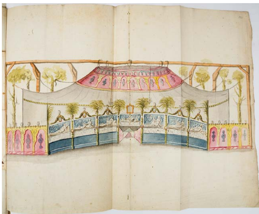
2. Wincenty Lesseur, Sala balowa w namiocie , Zapole, 1784 r., ołówek, akwarela, w: A.S. Naruszewicz, Podróż króla na sejm grodzieński 1784 , rkps 959 IV, k. 533, Kraków, Muzeum Narodowe.