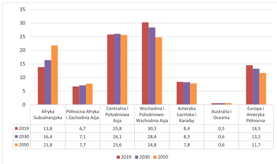
Rysunek 1 Udział różnych regionów w globalnej liczbie ludności w latach 2019, 2030 i 2050 (prognoza w procentach)