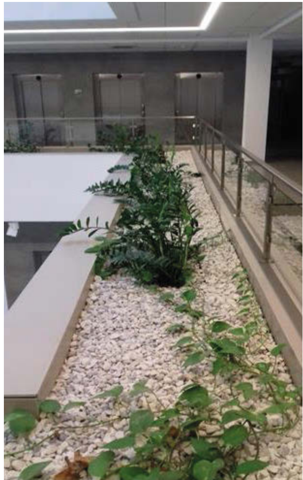
Il. 2. „Żywe rośliny” w atrium budynku Wschodniego Innowacyjnego Centrum Architektury (B4) stanowią skrawek natury w krystalicznie modernistycznym wnętrzu.