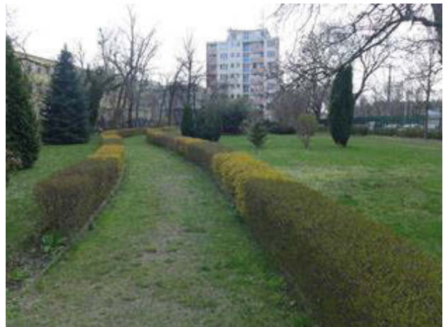
Il. 3. Ogród przy budynku Wydziału Psychologii UW (B5) — spójrzanie w głąb ogrodu. Widok wiosną i jesienią (fot. A. Lasiewicz-Sych, 2013/2015).