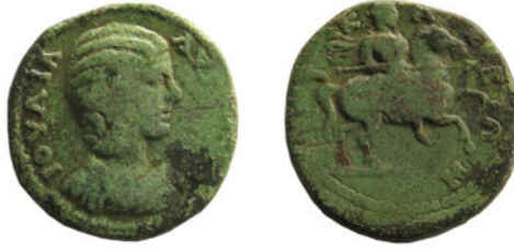
Ryc. 2. Moneta z portretem Julii Domny (AE 28; 12,53 g; 28 mm) z Korcevičy, obw. witebski, Białoruś. Gabinet Numizmatyczny Wydziału Historycznego Białoruskiego Uniwersytetu Państwowego, nr inw. A39-17-1.

Została znaleziona niedaleko wsi Korcevičy (biał. Корцевічы) w rejonie cząstniczym obwodu witebskiego, niedaleko rzeki Uły. Opis monety: