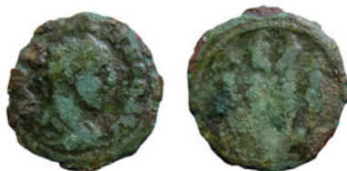
Ryc. 4. Moneta Gordiana III (AE 19; 2,97 g; 19 mm) z Prużany, obw. brzeski, Białoruś. Prywatny zbiór M. Papieki.

Ostatnią, najpóźniejszą monetą bityńską z Białorusi jest brąz Gordiana III (ryc. 4), znaleziony w okolicach miasta Prużana w obwodzie brzeskim, w dorzeczu rzeki Muchawiec – prawego dopływu Bugu.