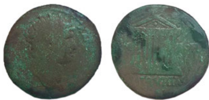
Ryc. 1. Moneta Hadriana (AE 26; 10,36 g; 26 mm) z Rehispolle, obw. miński, Białoruś. Gabinet Numizmatyczny Wydziału Historycznego Białoruskiego Uniwersytetu Państwowego, nr inw. A2-20-1.

Okaz ten został znaleziony w 2018 r. koło wsi Rehispolle (biał. Рэгісполле) na terenie rejonu berezyńskiego, w obwodzie mińskim, nieopodal ujścia rzeki Usa, przy jej zbiegu z Berezyną (prawy dopływ Dniepru). Blisko miejsca znaleziska znajduje się grodzisko datowane na wczesną epokę żelaza, a także osada o nieustalonej chronologii 7 . Opis monety: