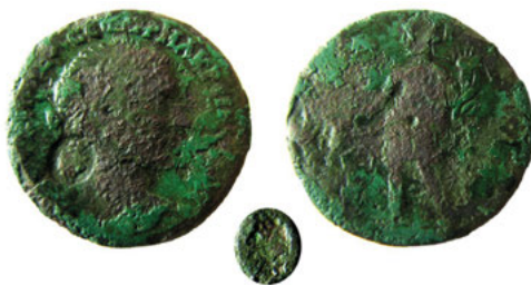
Ryc. 3. Moneta Makrynusa (AE 26; 9,85 g; 26 mm) z Juzafowa, obw. witebski, Białoruś. Prywatny zbiór A. Fiasenki.

Miejsce odkrycia monety położone jest nieco na zachód od jeziora Plisa, znajdującego się w dorzeczu zachodniej Dźwiny, w górnym biegu jej lewych dopływów. Opis monety: