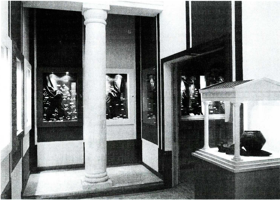
Ryc. 2. Wystawa numizmatyczna w Muzeum Archeologicznym i Etnograficznym w Łodzi.

przybory piśmienne. Obok sejf. Całość oświetla żyrandol. Wchodząc do czwartej sali, znajdujemy się we współczesnym banku. Meble są współczesne, proste, jasne, a najważniejszą część stanowią okienka kasowe.