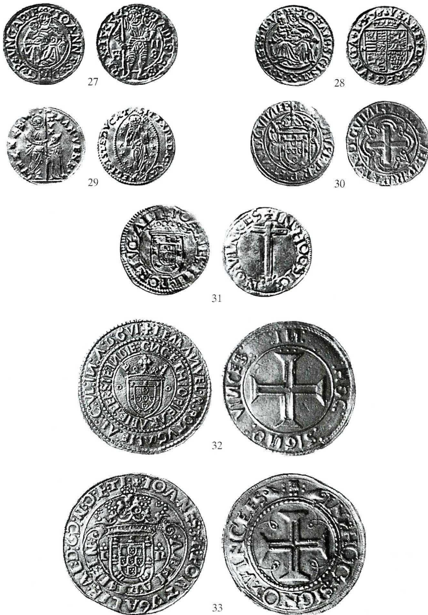
27. Węgry, Jan I Zapolya, dukat 1535, Kolozsvár (Cluj); wg SBV 15.2372. 28. Siedmiogród, Jan II Zygmunt i Izabela, dukat 1556, Nagybánya (Baia Mare); wg SBV 15.2418. 29. Wenecja, Francesco Venier, zecchino (1554–1556), 3,48 g; wg SBV 15.1680. 30. Portugalia, Emanuel I, cruzado (1495–1521); wg SBV 15.1923. 31. Portugalia, Jan III, cruzado calvario (1521–1557); wg SBV 15.1924. 32. Portugalia, Emanuel I, portuguéz (1499–1521), Lizbona, 35,40 g; wg SBV 37.2400. 33. Portugalia, Jan III, portuguéz (1521–1557), Lizbona, L–R, 35,37 g; wg SBV 29.1257.