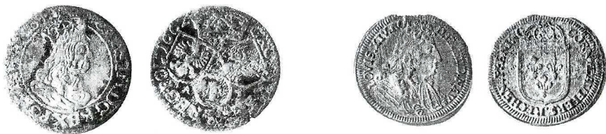
Ryc. 6. Wrocław, ul. Drobnera. Szóstak koronny Jana Kazimierza i liczman norymberski. Skala 1:1