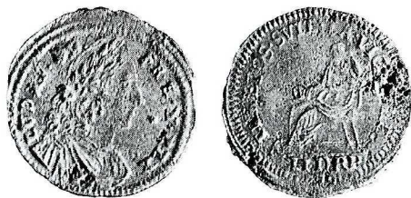
Ryc. 5. Wrocław, nabrzeże. Liczman norymberski. Skala 1,5:1

VII. M.: Wrocław — Leśnica, „Cmentarz przykościelny”, zapewne przy kościele pw. św. Jadwigi przy ul. Wolskiej, gdyż przy cmentarzu przy ul. Trzmielowickiej nie ma kościoła, a z kolei przy kościele przy ul. Wł. Skoczylasa nie ma cmentarza. D.: 1958. Ok.: nieznane. L.: 1 moneta. Zbiór: Muzeum Narodowe we Wrocławiu, sygn. MNWr.-X-22469 (monetę nabyto 30.XII.1978 r.) 5 .