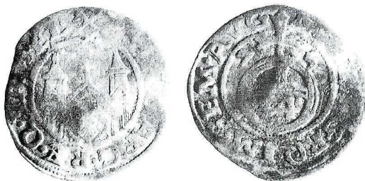
Ryc. 4. Wrocław, nabrzeże. Grosz miasta Hameln. Skala 1,5:1

3. Hameln , miasto, grosz (1/24 talaria) 7–5 (1575). Av. widok katedry p.w. św. Bonifacego (kościół zwieńczony krzyżem, z dwiema wysokimi wieżami po bokach, również ozdobionymi krzyżami). W bramie kościoła herb miasta: żelazna piasta kamienia młyńskiego, w otoku: MO [-] NO [-] ARG · RE · Q · HAME · (znak menniczny w postaci 2 skrzyżowanych haków); Rv. jabłko panowania z wpisaną cyfrą wartości Z4, nad jabłkiem po bokach krzyża skrócona data 7–5, w otoku: [MAX]I [-] D · G · RO · IM · SEM · AVG, dalej znak menniczny przedstawiający 2 skrzyżowane haki; Pflümer tabl. 5, nr 45 (ale tu tylko rok [15]74), Saurma nr 3843, tabl. LXX, il. 2111; 1,6349 g, 21,7 mm, nr inw. pol. 4/2000.