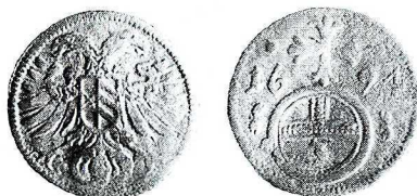
Ryc. 3. Wrocław, nabrzeże. Greszel Leopolda I, men. Opole. Skala 1,5:1

2. Królestwo Czeskie , Leopold I (1657–1705), greszel 1694, men. Opole. Av. Hal. 1684; Rv. jak Hal. 1685, ale po bokach krzyża perełki; 0,3661 g, 15,3 mm, nr inw. pol. 1/2000.