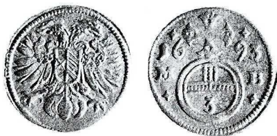
Ryc. 2. Wrocław, nabrzeże. Greszel Leopolda I, men. Brzeg. Skala 1,5:1

2. Królestwo Czeskie , Leopold I (1657–1705), greszel 1694, men. Opole. Av. Hal. 1684; Rv. jak Hal. 1685, ale po bokach krzyża perełki; 0,3661 g, 15,3 mm, nr inw. pol. 1/2000.