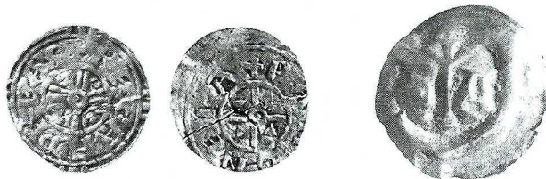
Ryc. 1. Wrocław, Ostrów Tumski. Denar Andrzeja I i brakteat Henryka Brodatego. Skala 1,5:1

Węgry , Andrzej I (1046–1060), denar. Av. Krzyż równoramienny, którego każde z ramion zbudowane jest z trzech belek. Ramiona wychodzą od małego okręgu z perełką w środku, w otoku: +REX·ANDREAS; Rv. Krzyż równoramienny, którego ramiona odchodzą od małego okręgu z perełką w środku, w kątach ramion krzyża po dwie perełki, w otoku: +PANONEIA. Huszár nr 9; 14,0 mm, moneta została przelamana na dwie części w momencie odkrycia.