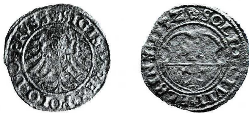
Ryc. 2. Szeląg elbląski Zygmunta I Starego z 1532 r. (nr kat. 1). Skala 1,5:1