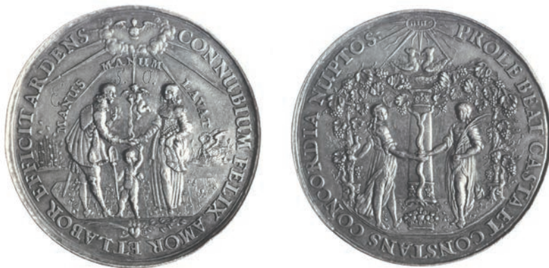
6. [XVII.] Johann Höhn starszy, Medal ślubny okolicznościowy, XVII wiek (PAN Biblioteka Gdańska [nr inw. 16])