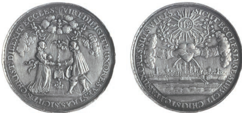
5. [XVI.] Johann Höhn starszy, Medal ślubny okolicznościowy, XVII wiek (PAN Biblioteka Gdańska [nr inw. 11], fot. Karol Nowaliński)