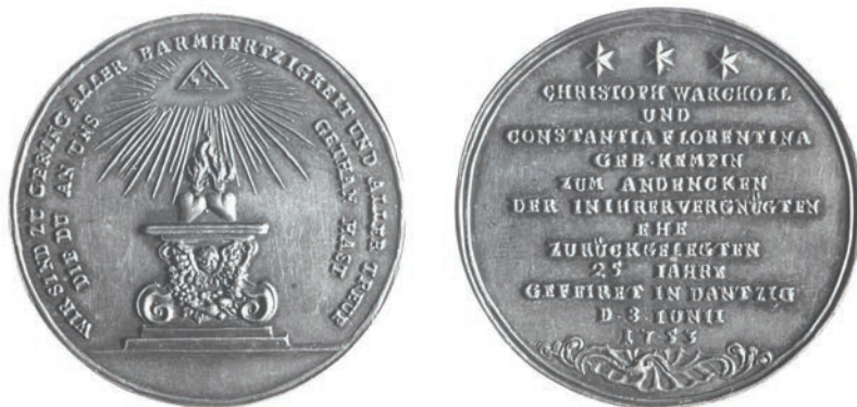
7. [XXV.] Medal na srebrne gody Christopha Warcholla i Constantii Florentyny Kempe, 1753 rok (PAN Biblioteka Gdańska [nr inw. 10])