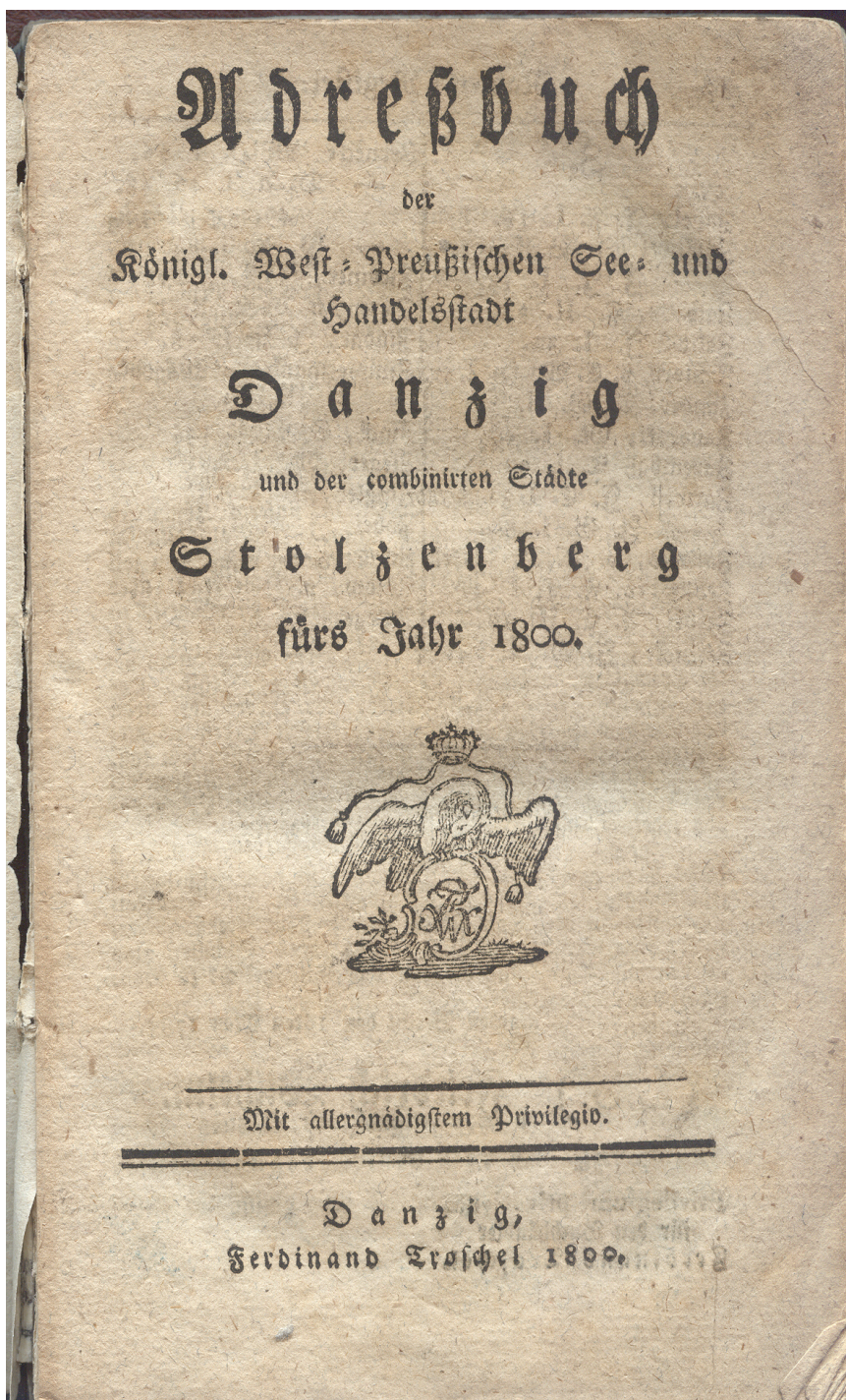
4. Adressbuch der Königl. West-Preussischen See und Handelsstadt Danzig und der combinirten Städte Stolzenberg fürs Jahr 1800 , Danzig 1800, karta tytułowa (PAN Biblioteka Gdańska, sygn. Uph o. 4838)