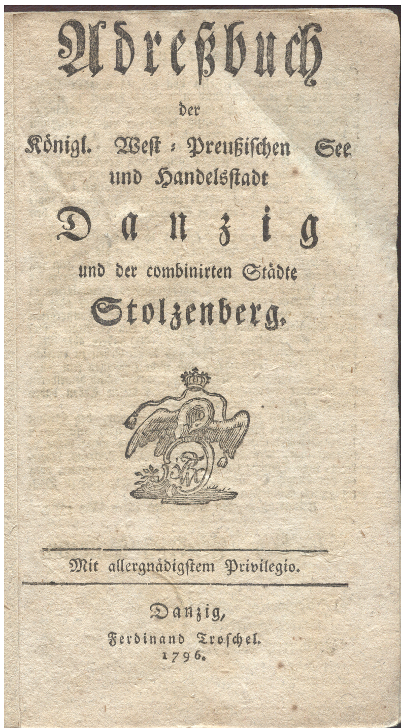
1. Adressbuch der Königl. West-Preussischen See und Handelsstadt Danzig und der combinirten Städte Stolzenberg , Danzig 1796, karta tytułowa