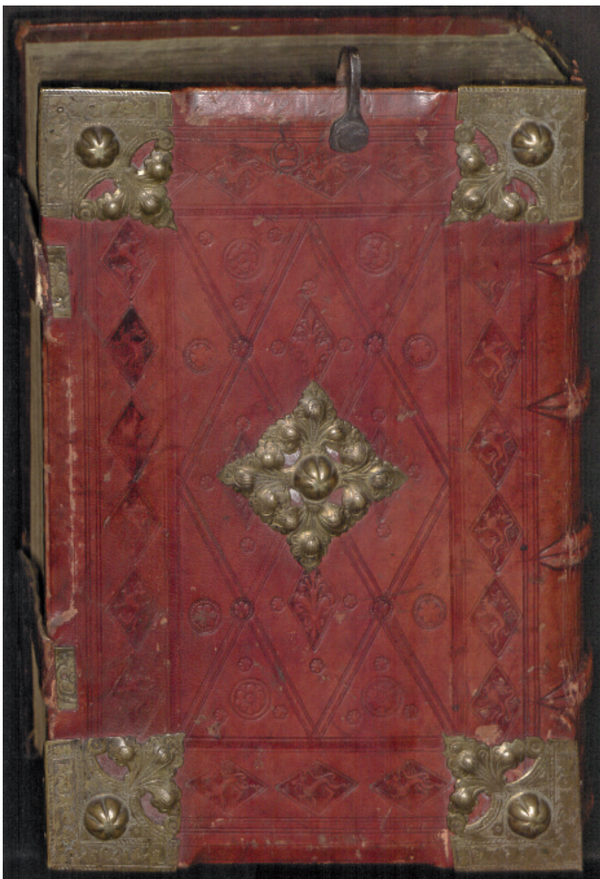
4. Oprawa z superekslibrisem Jana Waltera z Chojnic (dolna okładzina), Warsztat 1/Introligator Smoka Mł., Gdańsk, około 1500 (przed 1512) (PAN Biblioteka Gdańska, fot. K. Nowaliński)