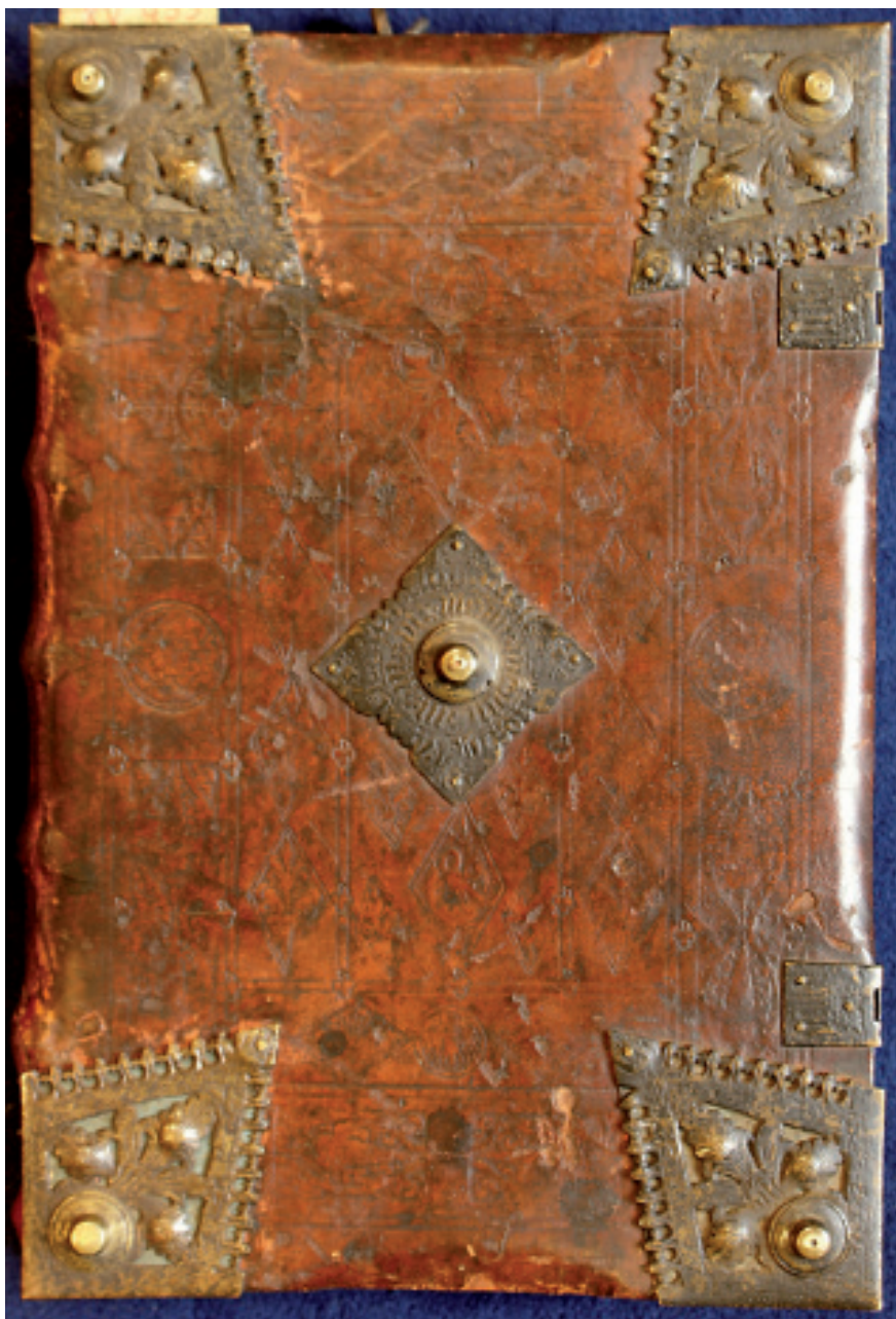
5. Oprawa z superekslibrisem Jana Waltera z Chojnic (górna okładzina), Warsztat 1/Intrologator Smoka Mł., Gdańsk, około 1500 (przed 1512) (PAN Biblioteka Gdańska)