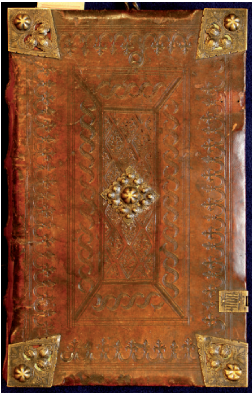
6. Oprawa z supereklibrisem Jana Waltera z Chojnic (górna okładzina), Warsztat 1/Introligator Smoka Mł., Gdańsk, około 1500 (przed 1512) (PAN Biblioteka Gdańska, fot. A. Wagner)