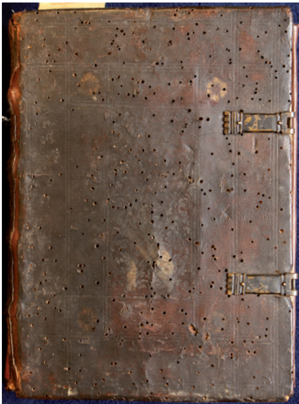
9. Oprawa z supereklibrisem Jana Waltera z Chojnic (dolna okładzina), Warsztat 3/Introligator pnącza i konara, Gdańsk, około 1500 (przed 1512) (PAN Biblioteka Gdańska, fot. A. Wagner)