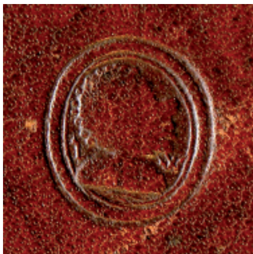
1. Superekslibris Jana Waltera z Chojnic, anonimowy złotnik lub pieczętarz (tłok), Warsztat 1/Intrologator Smoka Mł. (wycisk na oprawie), Gdańsk, około 1500 (przed 1512)