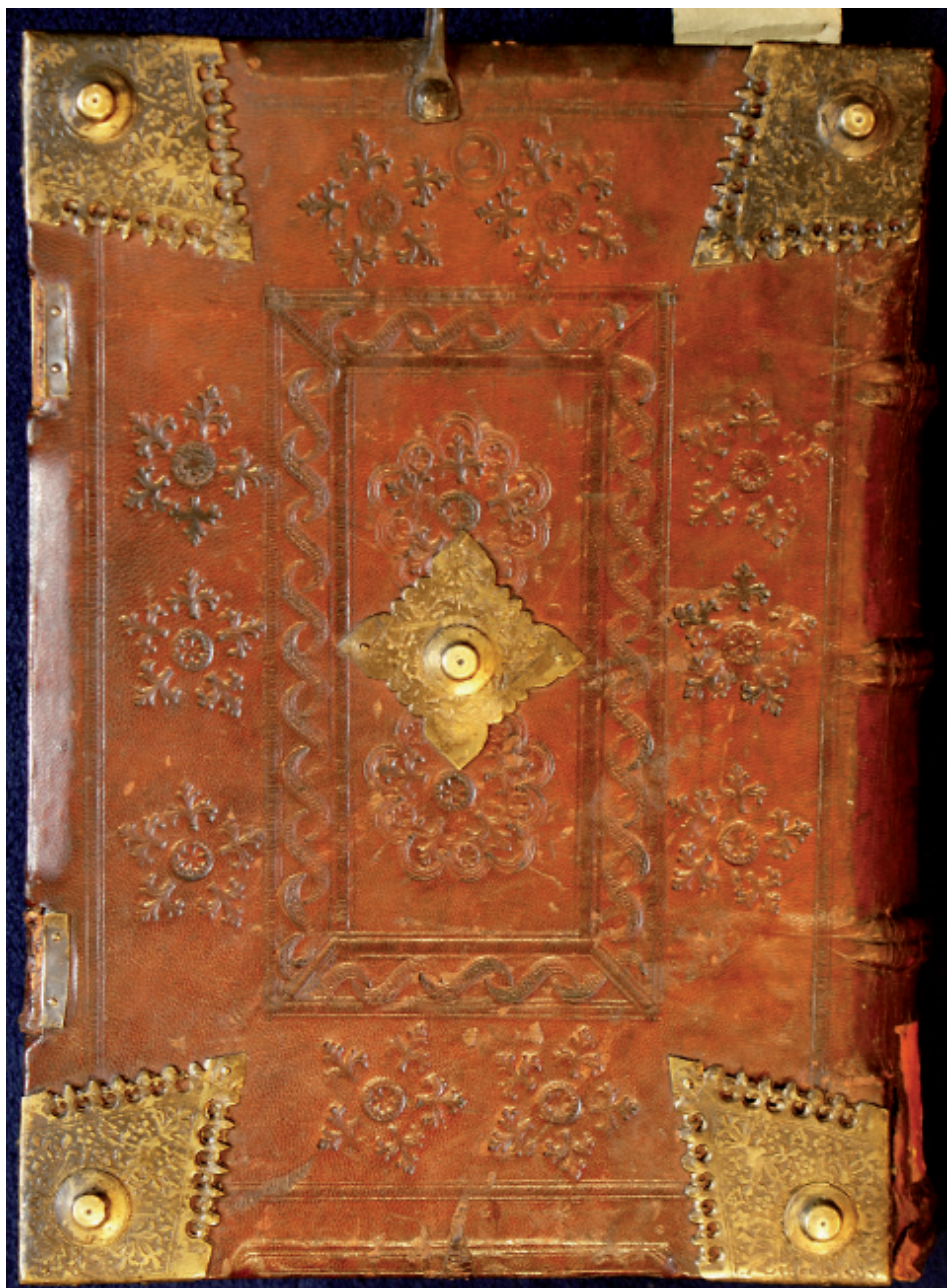
8. Oprawa z superekslibrisem Jana Waltera z Chojnic (dolna okładzina), Warsztat 1/Introligator Smoka Mł., Gdańsk, około 1500 (przed 1512) (PAN Biblioteka Gdańska, fot. A. Wagner)