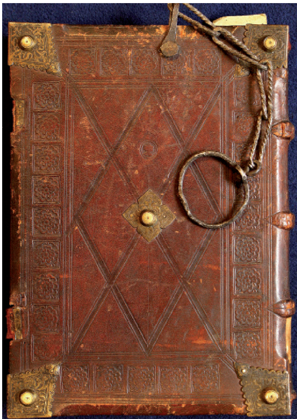
7. Oprawa z superekslibrisem Jana Waltera z Chojnic (dolna okładzina), Warsztat 1/Intrologator Smoka Mł., Gdańsk, około 1500 (przed 1512) (PAN Biblioteka Gdańska, fot. A. Wagner)