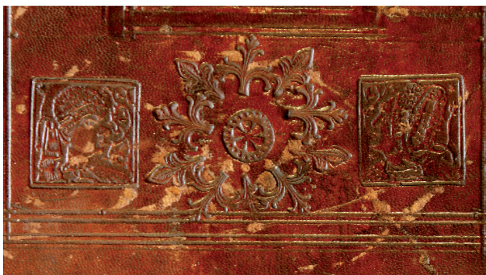
3. Wizerunki Murzyna (po lewej) i Murzynki? (po prawej) jako dekoracja oprawy z Warsztatu 1/Intrologatora Smoka Mł., Gdańsk, około 1500 (PAN Biblioteka Gdańska, fot. A. Wagner)