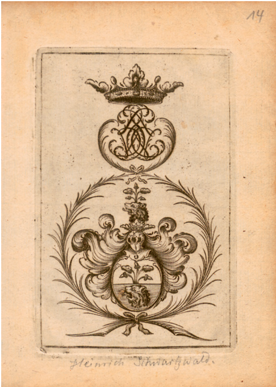
3. Herb rodzinny używany przez Heinricha Schwarzwalda V, miedzioryt, [w:] Wapenbuch der Obrigkeit in Dantzig durch Nicolaum Lang , 1693 (PAN Biblioteka Gdańska)