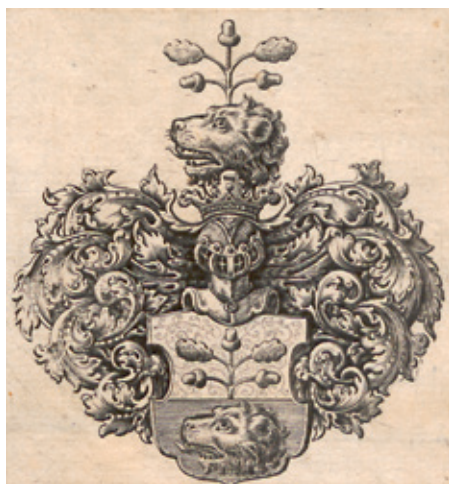
4. Ekslibris biblioteki Heinricha Schwarzwalda IV miedzioryt i akwaforta Johanna Bensheimera (?), przed 1672 r. (PAN Biblioteka Gdańska)