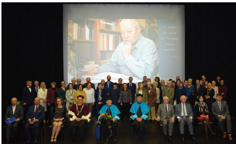
Jubilat z gośćmi.