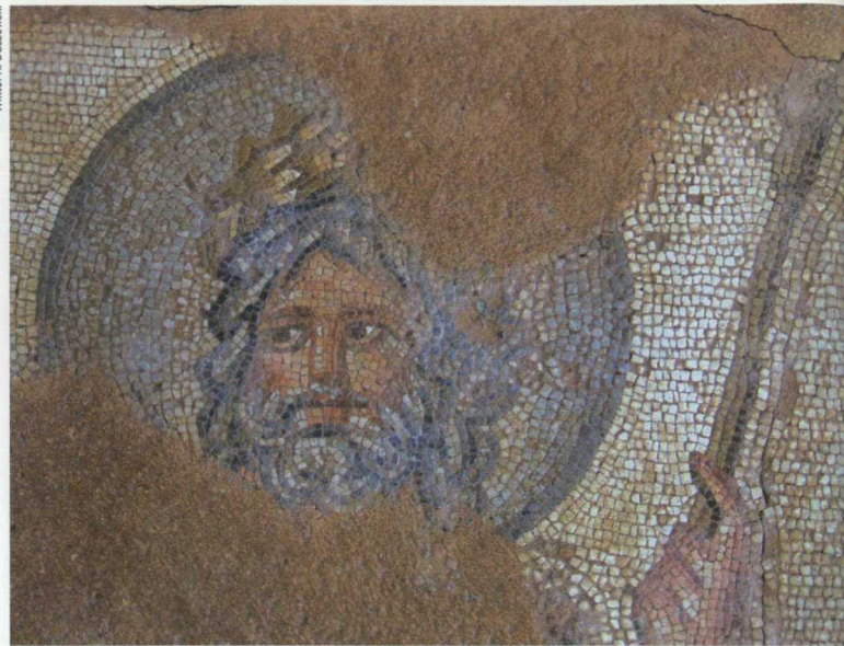
Wyobrażenie Boga Wiecznego Czasu na mozaice triclinium w Domu Aiona