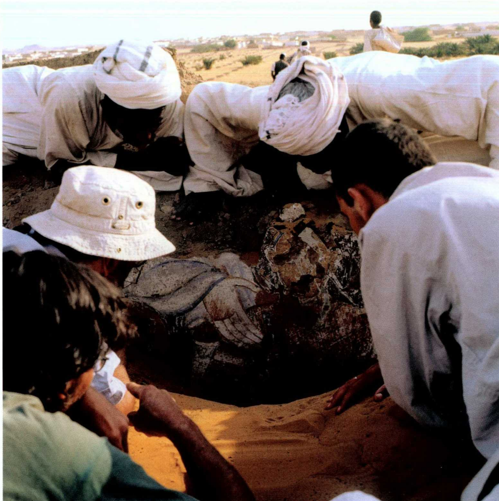
Moment odkrycia malowideł ściennych w Banganarti